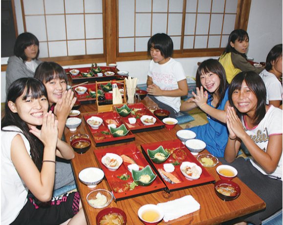
▲民宿では温かい夕飯を用意してくれました。体を動かした後のごはんは最高!