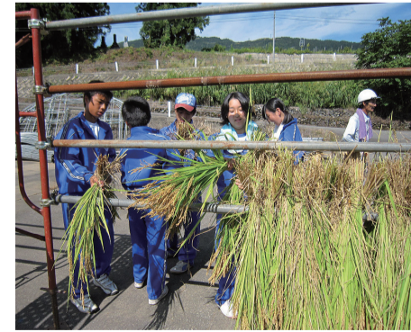
▲刈り取った稲を束にして、棒にかけて天日に干します

「ありがとう」の思いでいっぱい! 魚沼自然教室は、多くの支えがあった初めての実のある「学びの場」となります。田植えの仕方を教えてくれ、夏の間米を育ててくれた農家の方たち。温かく迎え入れてくれた民宿の方たち。共に過ごした仲間たち。多くの支えを感じた生徒たちは、感謝の気持ちを学んだのではないのでしょうか。