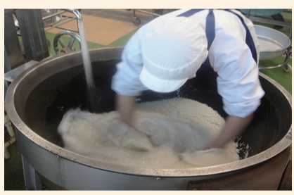
▲農家や調理員など多くの人の手を経て、足立区の給食は作られています