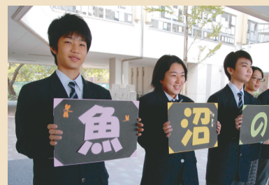
▲「魚沼のみなさんようこそ!!」プラカードを手に歓迎