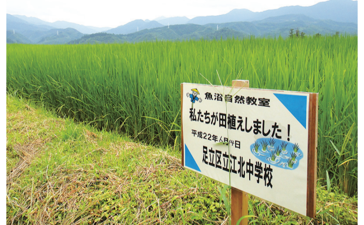
▲青々と育った8月の稲。夏の間は地元農家の人たちが生徒たちに代わって精魂込めて育ててくれました