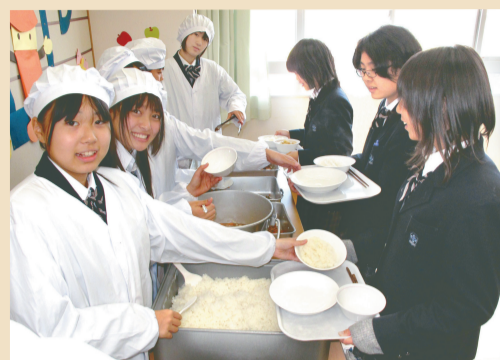
▲ほかほかのごはんが運ばれてきました。期待は高まるばかり!