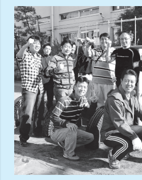
▲「おやじの会」のメンバー。避難所設営には地域の皆さんの力が必要