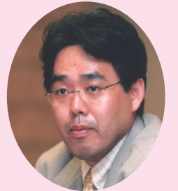
▲川島隆太氏(東北大学加齢医学研究所教授)

定員=100人(12月26日から先着順) ※保育あり(要予約、2歳以上、先着10人、1人50円<保険料>) 申し込み方法=電話 申込期限=23年1月26日(水)