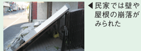
▲民家では壁や屋根の崩落がみられた