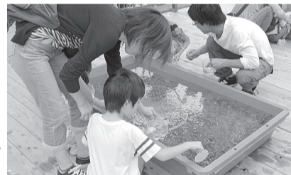
▶ 何匹すくえるか挑戦しましょう

日 3日(祝)～5日(祝) 午後1時～3時30分 ※雨天決行 対 小学生以下の方 料 1回100円 ※持ち帰りは5匹まで 申 不要 ※当日直接会場へ 場 問 生物園 ☎3884-5577