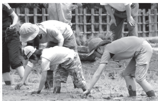
▶ 気軽に農業体験ができます

日 5月21日、6月25日、10月8日、11月12日、いずれも土曜日 午前10時～正午/午後1時30分～3時30分 ※天候などにより日程変更あり 対 小学3年生以上の方 内 有機農業者の指導の下、田植えから脱穀・精米までの作業を体験 定 ▷午前…25人 ▷午後…40人 ※いずれも抽選 料 1人1,000円(保険料など) 申 往復ハガキまたはEメール(携帯メール不可)で希望者全員の住所、氏名(フリガナ)、年齢、電話番号、「イネ作り体験」、午前・午後の希望を連絡 ※1通で2人まで 縮 4月28日(水)必着 場 問 都市農業公園 〒123-0864鹿浜2-44-1 ☎3853-4114 〓toshinou@city.adachi.tokyo.jp