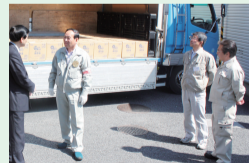
▲県を超え支援物資が到着