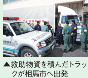
▲救助物資を積んだトラックが相馬市へ出発