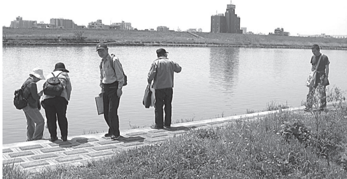
▶ ゆっくりと海をめざして歩いてみましょう

問 荒川ビジターセンター 〒120-0034千住5-13-5(学びピア21内) ☎5813-3753 〓ara-vc@adachi.ne.jp