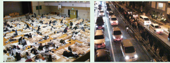
▲急ぎよ用意された避難所や道路に帰宅困難者があふれた