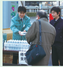
▲区役所前でも水と食料を供給