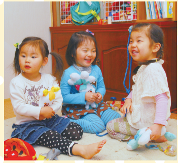
▲朝9時ごろから夕方5時くらいまで保育ママの下で過ごす3人。笑顔が絶えない