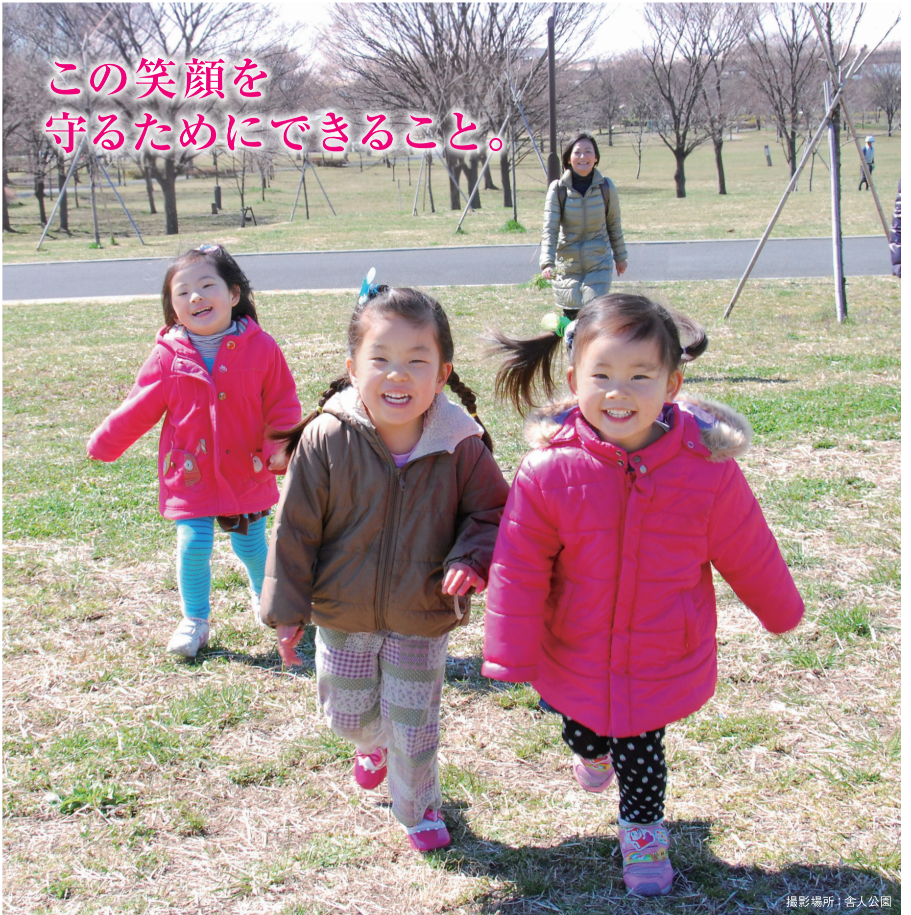
撮影場所：舎人公園