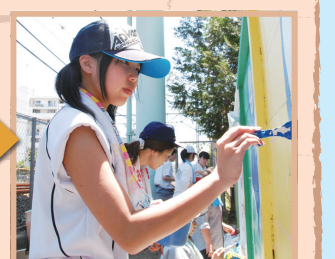
▲7月11日、潤徳女子高校1年生の6人がビュー坊を描きました

7月上旬、東武伊勢崎線沿いの塀に描かれた落書きを消し、その上に「ビュー坊」を描く活動を行いました。