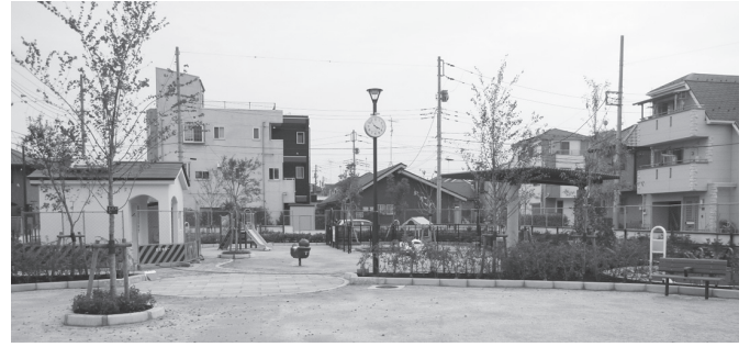
近くに住んでいる方は、ぜひお越しください

花畑北部2号公園が新たに「花六東公園」として開園します。幼児の遊具コーナー、健康器具、135mのウォーキングコースなどがあります。開園予定日=8月19日(金) 所在地=花畑6-23-9 問先=公園建設係 ☎3880-5896