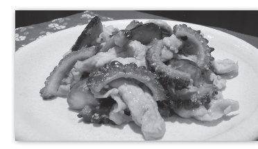
ナスとゴーヤーのピリ辛みそ炒め

ナスとゴーヤーのピリ辛みそ炒め 食欲増進の効果があるゴーヤーと、疲労回復によい豚肉で夏バテ予防になります。 調理時間20分 1人分で259kcal 塩分1.2g 材料(4人分) ナス……………2本 ゴーヤー……………1本 豚肉細切れ……………240g ショウガ……………適量 みそ……………大さじ2 しょうゆ……………小さじ1 酒……………大さじ2 作り方 ①ゴーヤーは縦半分に切り、種とわたを除いてうす切りにする。ショウガはみじん切りにする。ナスは乱切りにして、水にさらす ②みそ、しょうゆ、酒、砂糖を混ぜておく ③フライパンに油を熱し、ナスとゴーヤーを炒め、油がなじんだら取り出す ④フライパンに油を少し足して、豆板醬、ショウガ、豚肉を炒め、肉の色が変わり、火が通ったら、ナスとゴーヤーを加えてさっと炒め、②をからませる