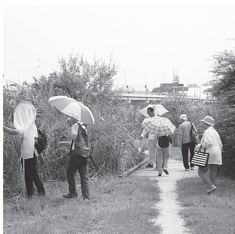
▲夏の朝、草花や生き物を調べながら歩きますか?

日場▷8月28日(日) 午前10時～正午…荒川左岸(東武線鉄橋下～堀切橋) ※当日、午前9時50分から荒川左岸・東武線鉄橋下で受け付け開始 ▷9月4日(日) 午前10時～正午…荒川千住新橋緑地左岸(わんど広場) ※当日、午前9時50分から荒川ビジターセンターで受け付け開始 内草花や昆虫、野鳥などを観察しながら荒川河川敷を歩く 持帽子/水筒 定各20人(先着順) ※就学前の子どもは保護者同伴 申不要 ※当日直接会場へ。小雨決行 問荒川ビジターセンター ☎5813-3753