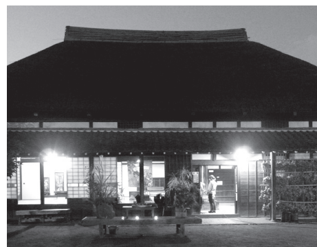
▲できあがった飾りとお団子をお供に、古民家でお月見をしましょう