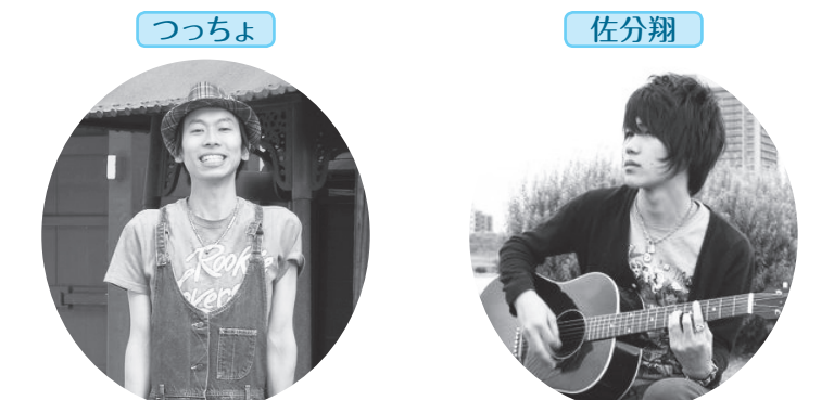
▲足立区生まれ、足立区育ちの「下町シンガー」。区内を中心に活動しています ▲19歳のシンガーソングライター。竹の塚や千住をはじめ、都内のライブハウスで活動中

日時=8月18日(木) 午後2時開演 ※午後1時30分開場 場所=天空劇場(東京芸術センター21階) 内容=あだちエンターテイメントチャレンジャー支援事業参加のソロミュージシャンたちによる公開練習(セッション・ソロでのステージ) 定員=400人(先着順) 申込=不要 ※当日直接会場へ 問先=地域文化支援係 ☎3880-5986