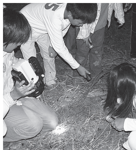
▲どんな鳴き声なのか耳をすませて聞いてみましょう

日9月17日(土) 午後6時～8時 対小学生以上の方 ※小学生は保護者同伴 内虫の鳴き声を学んだ後、園内で鳴く虫を探し観察 定20人(抽選) 申窓口または往復ハガキ・ファクス・Eメール(携帯メール不可)で希望者全員の住所、氏名(フリガナ)、年齢、電話・ファクス番号、「秋の鳴く虫コンサート」を連絡 締9月6日(火)必着 場問あやせ川清流館(桑袋ピオトープ公園内、月曜日休館) 〒121-0061花畑8-2-2 ☎3884-1021 FAX 3884-1041 問bio-park@adachi.ne.jp