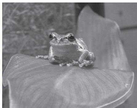
▲ニホンアマガエルは雨を予知する? ウソホント?

料入園料 申▷生きものウソホント大検証…往復ハガキに希望者全員の住所、氏名(フリガナ)、年齢(学年)、電話番号、「生きものウソホント大検証」を明記し郵送 ※返信面にも宛名を記入 ▷その他…不要 ※当日直接会場へ。午前9時30分受け付け開始(カマキリ展は受け付けなし) 場問生物園 〒121-0064保木間2-17-1 ☎3884-5577