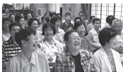
▲みんなで合唱する「うたごえ仲間」の様子

この下は広告スペースです。内容については各広告主にお問い合わせください。広告掲載のお問い合わせは、報道広報課へ ☎3880-5815