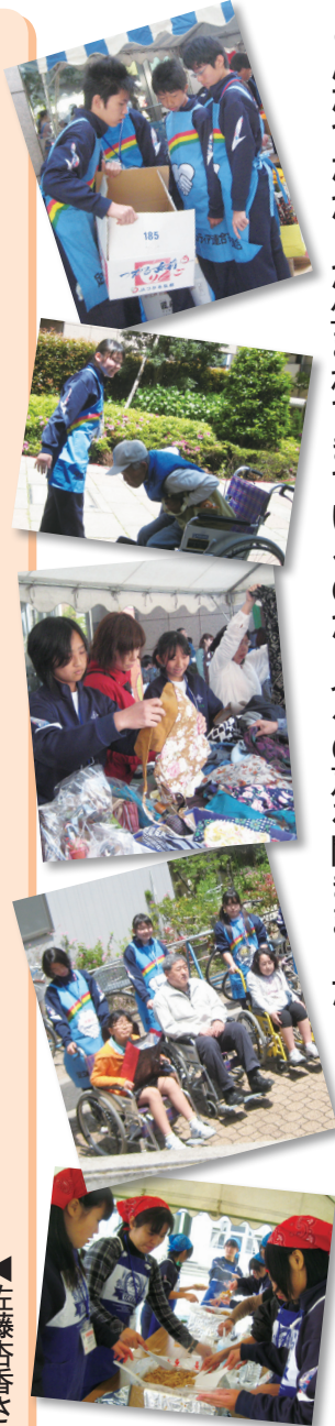
▲西新井では中学生たちがまちで様々なボランティア活動を行っています

西新井のまちでは、中学生のボランティア活動を介して、子どもたちとまちの人たちの間に互いを思う気持ちが生まれてきたといえます。どんなつながりが生まれてきているのか、人々の声を聞きました。