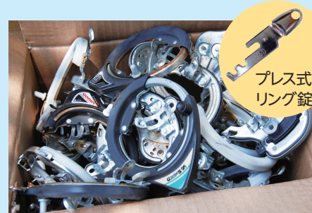
▲取り外されたプレス式のリング錠