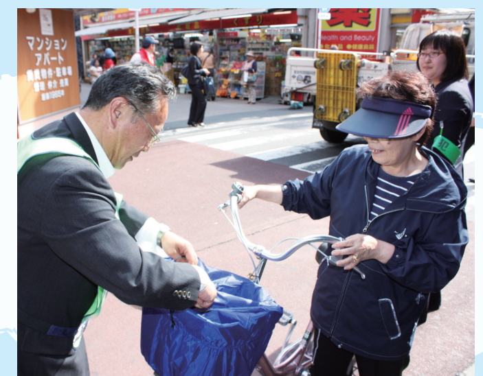
▲ひったくり防止のかごカバーの取り付けに笑顔で応じる

取り付けに応じたまちの人は「最近の綾瀬地区は路上でタバコを吸う人も少なくなり、とてもきれいになった。いろいろな意味で安全になったと感じますが、カバーがあると安心です」と笑顔で語っていました。カバーは安価で効果が高いグッズです。みなさんもぜひ、「ぱっちりカバー」を実践しましょう。