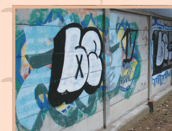
▲犯罪やモラルの低下を招きかねない落書き