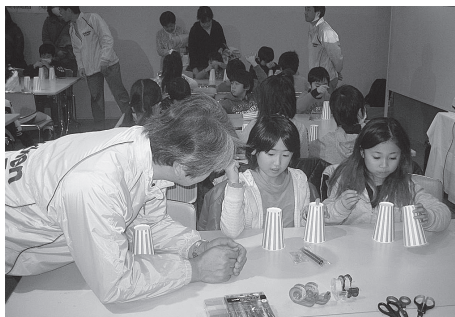
▲うまく楽器が作れるかな?

日時=8月21日(日) 午後2時~5時 場所=こども科学館(ギャラクシティ内) 対象=小学生と保護者 内容=遊びながら様々な体験ができる施設として、25年4月にリニューアルオープンするギャラクシティの先取り体験イベント(キッズアスレチック/手作り楽器で遊ぼう/紙トンポを作って飛ばそう/あだち子どもクイズラリー/足裏測定コーナー/プラネタリウム特別番組など) 申込=不要 ※当日直接会場へ。足裏測定コーナーは先着50人、午後1時30分から受け付け開始 問先=施設更新担当 ☎3880-5273