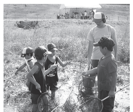
▲池の中に入ってザリガニや小魚など水辺の生き物を捕まえよう。そばにいる自然解説員が捕った生き物について教えてくれるよ

持ち物=帽子/水筒 申込=不要 ※当日直接会場へ。小学校低学年以下の方は保護者同伴。小雨決行、荒天中止