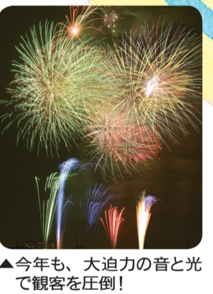
▲今年も、大迫力の音と光で観客を圧倒!