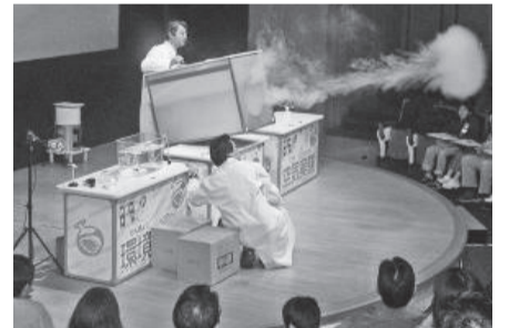
▲不思議な実験に思わず目がくぎ付け!

対象=就学前の子どもと保護者 持ち物=上履き・スリッパ 申し込み方法=不要 ※当日直接会場へ