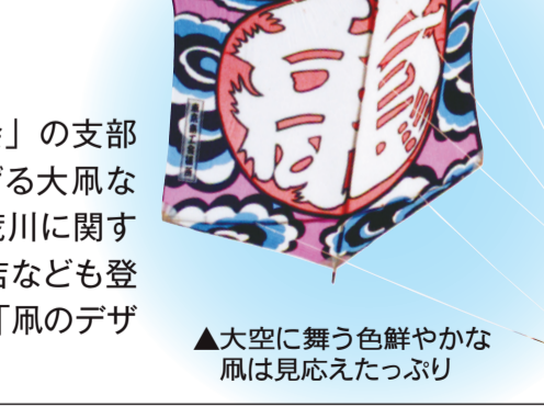
▲大空に舞う色鮮やかな凧は見応えたっぷり

色とりどりの凧が大空を舞う! 全国から「日本凧の会」の支部の皆さんが集まってあげる大凧などが鑑賞できるほか、荒川に関する展示コーナーや模擬店なども登場します。 ※雨天時は「凧のデザインコンクール」に変更