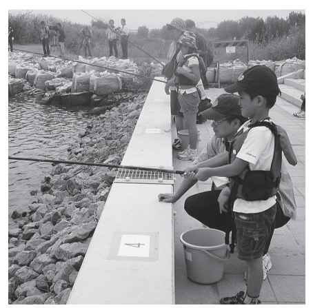
▲荒川の本流で釣り体験ができる貴重な機会。ハゼが釣れるかも?