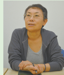
▲「相談すれば解決できる虐待も多い」と有坂所長

的虐待につながる場合があります。また、認知症の人の徘徊を止めようとして、たたいたり、強く押さえつけたりする身体的虐待も少なくありません。介護者に悪気がなくても、高齢者の体にあざが残るようならそれは明らかに虐待です。放置や閉じ込めなどの介護放棄