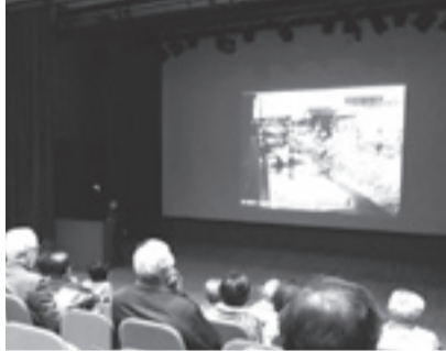
▲大きな画面で迫力満点

日2月26日(日) 午後1時30分～3時 ※写真展は午後1時～4時 場生涯学習センター・講堂(学びピア21内) 内荒川の写真を大画面で見ながら、昔の荒川を知る方の思い出話を聞く 定100人(先着順) ※就学前の子どもは保護者同伴 申不要 ※午前9時から荒川ビジターセンターで参加証配布