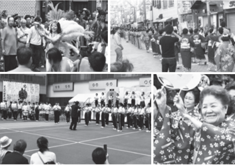
▲フェア当日は、学園通りや足立学園でのステージなど、まちのいたるところでイベントが行われる。出演は小・中学校の吹奏楽部から、大学生のダンスやサンバ、町会の流し踊りなど多岐にわたり、出演者も見学者も笑顔になれるイベント