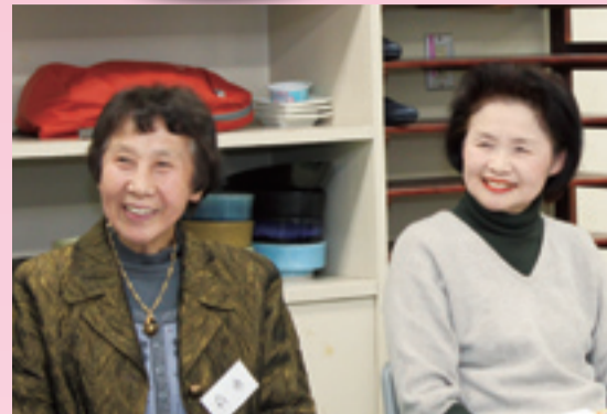
▲ことば教室の様子。笑顔で大きな声で発声。和気あたたかした雰囲気です