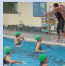
▲プールの中で楽しくエクササイズ(東綾瀬公園温水プールの「アクアエクササイズ」)