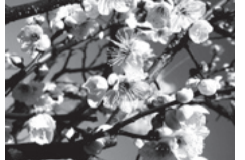
▲様々な種類の白梅・紅梅が楽しめます

日2月19日(日) 午後1時30分～2時30分 内人間や動物の顔に見える冬の木の芽の模様を観察する 定20人(先着順) ※就学前の子どもは保護者同伴