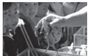
▲一度に約5,000個の卵を産みます

日3月4日(日) 午後1時30分～2時30分 ※午前9時30分から受け付け開始 内アズマヒキガエルの卵や冬眠の様子を観察 定20人(先着順) ※就学前の子どもは保護者同伴