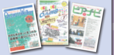
▲センターごとに個性あふれる講座を紹介しています

各センターでは、毎月講座の案内などを掲載した冊子を作成しています。あだち広報では紹介しきれない講座も掲載しています。各センターで配布していますので、ぜひ手に取ってご覧ください。