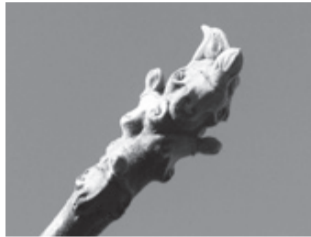
▲だれかの顔に見えてくるかも!?