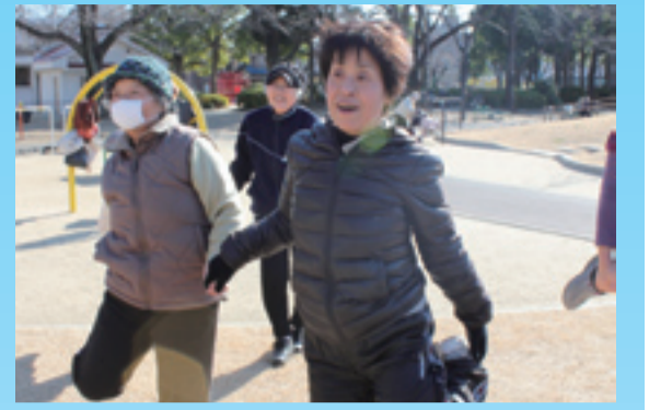
▲寒空の下でも筋トレでほかほか。自然と笑顔になります