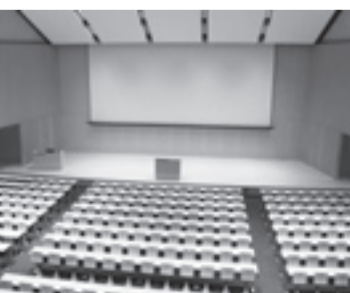
▲500人が入る大ホールでは区民向けの講座なども開催される予定

4月の開設後は、広場、カフェ、図書館などが地域の人々にも開放される予定です。地域の人々との交流や、緑豊かな景観などを通し、まちづくりにも大きく関わる地域に開かれたキャンパスが誕生します。