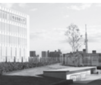
▲環境に配慮し、敷地内の緑化と共に屋上庭園などもあります