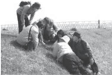
▲そこまで来ている春をじっくり観察

日3月4日(日) 午前10時～正午 ※午前9時50分から荒川ビジターセンターで受け付け開始 場荒川河川敷・虹の広場 内河川敷で草花を観察する 持水筒/帽子/動きやすい服装/防寒具/雨具 定20人(先着順) ※就学前の子どもは保護者同伴 申不要 ※当日直接会場へ