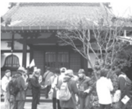
▲千住にくわしい案内人と一緒に歩きます

日3月11日(日) 午前10時～午後3時 場千住地域、荒川河川敷 内荒川放水路と関わりのある家屋、千住地域の銭湯や蔵などを見ながら歩く 定15人(抽選) ※小学生以下の方は保護者同伴 申希望者全員の住所、氏名、年齢、電話番号、「千住・荒川まちあるき」を往復ハガキまたはEメール(携帯メール不可) 締3月1日(木)必着