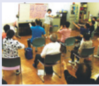
▲身近な場所で、気軽に続けられる教室です