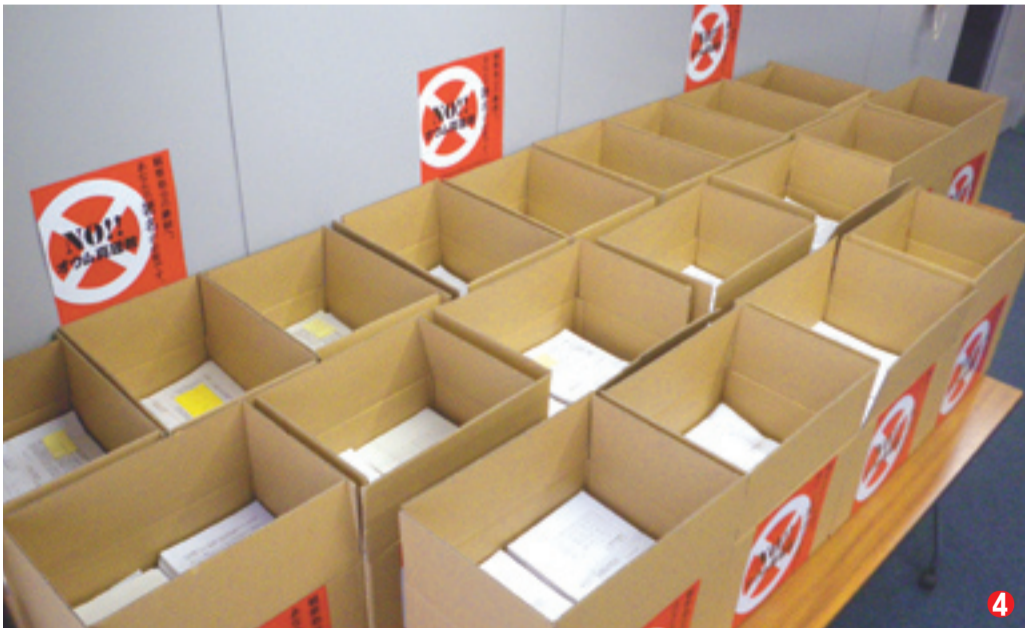
① 23年6月11日に行った住民協議会による抗議活動。約200人が参加 ② 23年9月・10月に行った駅頭などでの署名活動のPR ③ 23年10月25日、有馬康二 連合会長(中央右)・齋藤洋一住民協議会長(右)が足立区長と共に、集まった署名を法務大臣(当時)と公安調査庁長官へ提出 ④ 252,182筆の署名が集まった