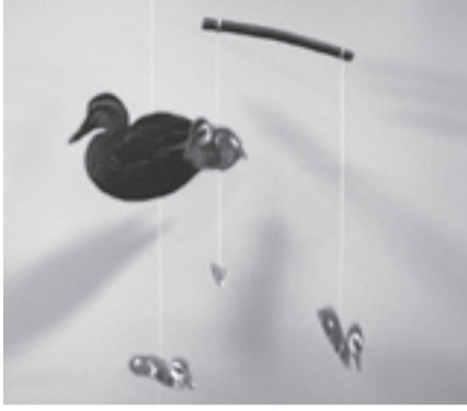
▲カルガモ親子のモビール

日2月26日(日) 午後2時～3時 内園内に生息する生き物のつながりを学んで、モビール(糸で木片を吊って作る飾り)を作る 定20人(先着順) ※就学前の子どもは保護者同伴 申不要 ※当日直接会場へ 場圃あやせ川清流館(桑袋ビオトープ公園内、月曜日休館)