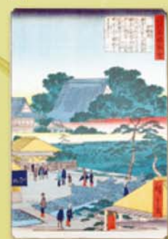
歌川広重二代 江戸名勝図会 西新井 慶応4(1868)年 戊辰戦争中に西新井大師と門前を描いた作品