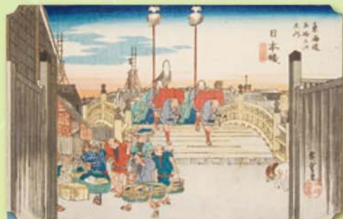
歌川広重 東海道五十三次之内 日本橋 天保4(1833)年 広重の出世作。橋上の大名行列、橋詰めの高札や魚屋の姿を描写している