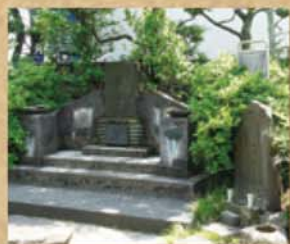
▲安藤広重の墓 東岳寺(伊興本町)

東海道五十三次で有名な浮世絵師広重。伊興本町の東岳寺に墓があることでも知られています。安藤広重とも歌川広重とも表記されます。広重の本名は安藤重右衛門といい、幕府定火消同心(幕府の消防を行う人)でした。浮世絵の師匠・歌川豊広から文化9(1812)年に許しを得て「歌川広重」と名乗りました。つまり安藤は本名の姓、歌川は浮世絵師としての名称なのです。