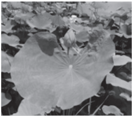
▲顔より大きな葉っぱにびっくり!

日7月8日(日) 午後2時～3時 ※午後1時45分から受け付け開始 場あやせ川清流館(桑袋ビオトープ公園内、月曜日休館) 内園内のハス田に咲くオオガハスの葉や茎を利用して遊ぶ 定20人(先着順) ※就学前の子どもは保護者同伴 申不要 ※当日直接会場へ