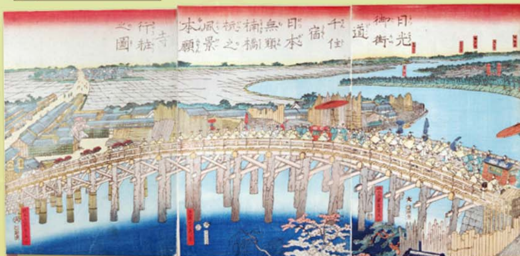
橋本貞秀 日光御街道千住宿日本無類橋杭之風景本願寺行粧之図 慶応元(1865)年 緻密な鳥瞰技法で知られた幕末明治の絵師貞秀が描いた千住大橋

浮世絵に描かれる足立の風景にも橋が登場します。橋と共に生きた当時の人々の生活が目に浮かびます。