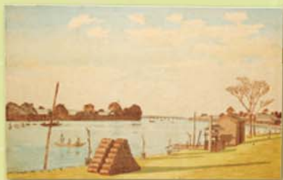
小林清親 大川富士見渡 明治13(1880)年 隅田川の富士見の渡し(現蔵前橋付近)と遠景に両国橋を描く