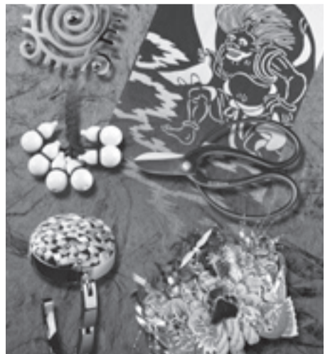
匠(たくみ)の技は時代を超える

日時=6月16日(土)・17日(日) 午前10時~午後 5時 場所=東京芸術センター21階・天空劇 場 内容=区内伝統工芸品の展示・販売・ 実演 ※各日とも先着100人にプレゼントあり 配布予定カード=足立堀之内公園の大 賀ハス、手ぬぐい(風神)など