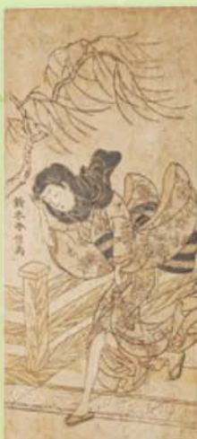
鈴木春信 風に悩む美人 宝暦年間(1751~64) 橋を渡る女性の姿。当時の着物や履き物が描かれている