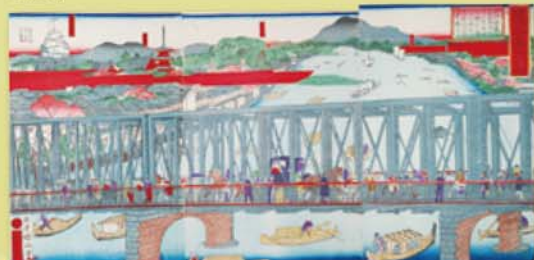
歌川国政四代 新築吾妻橋真図 明治20(1887)年 隅田川最初の鉄橋として注目された

橋は江戸~大正時代の日常生活における最大規模の建造物です。その構造に着目した作品も描かれました。