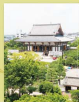
現在の西新井大師 浮世絵と同じく屋根が印象的な現在の大本堂(昭和47年建立)