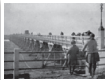
◀約80年前の西新井橋