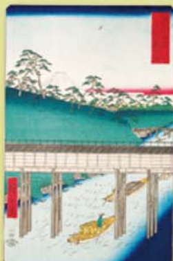
歌川広重 富士三十六景 東都御茶の水 安政5(1858)年 神田川の上水掛け樋の構造を描く