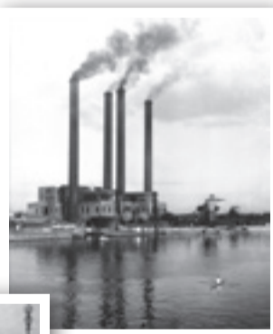
▲お化け煙突

皆さんからご応募いただいた写真を展示して、区の80年を振り返る写真展を全4回開催します。戦後発行が始まった区の広報紙も展示します。内容=昭和7年以降の写真(水害や駅舎、区内を走る都電など)をテーマ別に展示 配布予定カード=関屋の里など ※配布は平日の午後1時~4時限定