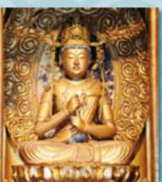
▶大日如来像(元禄12~1699年) 常善院(大谷田)

様々な特徴を持つ足立の仏教美術を展示するこの展覧会では、背景にある区内各地域の歴史や伝承、民俗行事なども紹介します。 23年1月から区内の文化遺産調査の一環として、仏像を中心とした仏教遺産の調査を行ってきました。江戸東京の近郊という立地により、区内にある仏像は江戸時代以降に作られたものが多いのですが、調査の結果、平安~室町時代の像も現存していることがわかりました。