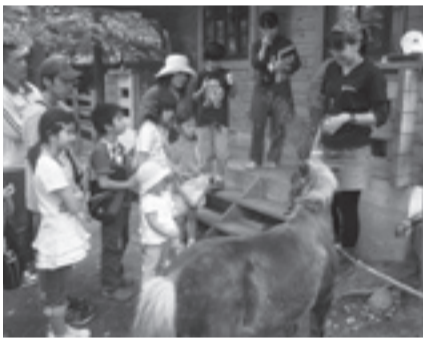
▲生きものを育てる大変さとやりがいを語るスタッフ

日7月7日(土) 午後1時30分～2時 ※午前9時30分から受け付け開始 内飼育員が生きもののことや飼育の体験談を紹介(7月のテーマは「ウニ・ナマコ・ヒトデ」) 定30人(先着順) ※就学前の子どもは保護者同伴