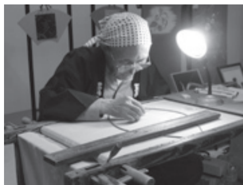
匠の技を間近で見るチャンス

ライトダウン キャンペーン 地球温暖化防止のため、全 国的に夏至の日と七夕の日に 一斉消灯を行います。明かり を消して夜空を眺め、いつも とは違う夏のひとときを楽し みませんか。 日時 6月21 日(木)、7月7日(土) 午後8時 開始 問先 温暖化対策係 (3880) 5860