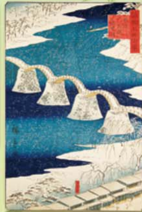
歌川広重二代 周防岩国錦帯橋 安政6(1859)年 錦川(山口県岩国市)の5連アーチ橋で著名。雪景色を和紙で表現した名作として知られる