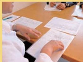
▲施設から介護サービスの説明を受ける。

現在同法人は、定期的に施設を訪ね、入所者と面会し、介護プランや施設が行う入所者の金銭管理の確認を行っている。また、入所者を成年後見制度に繋ぐなどの支援も行う。第三者の目が入ることで、客観性が保たれ、施設の正当性を立証することができる。