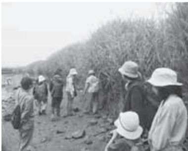
▲夏が近づく荒川をのんびり歩こう

■日時=6月1日(日)・15日(日)、午前10時～正午 ※午前9時50分から参加証配付 ■場所=▷1日…荒川河川敷・虹の広場(荒川ビジターセンター集合) ▷15日…西新井橋～千住新橋左岸(西新井橋下左岸集合) ■内容=荒川土手の草花や野鳥などを観察しながら歩く ※就学前の子どもは保護者同伴