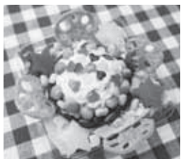
◀サラダを楽しむデコレーション

■日時=6月22日(日)、午前10時～10時45分/正午～午後0時45分/午後2時～2時45分 ■対象=3歳～小学生 ※小学3年生以下の方は保護者同伴 ■内容=パッケージサラダの製造・販売を行っている(株)サラダクラブによる、さまざまな野菜や具材をトッピングしたデコレーション・サラダづくり教室 ※試食あり。サラダの持ち帰り不可 ■定員=各16人