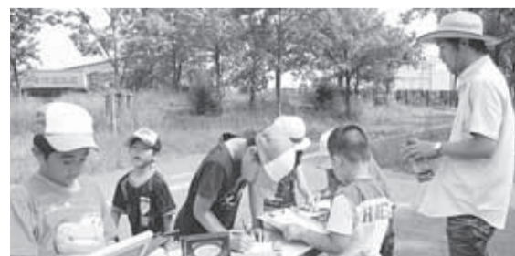
▲何ができるかは、当日のお楽しみ

■日時=6月8日(日)、午後2時～2時30分 ■内容=自然の見どころや遊びを園内に出す屋台で紹介 ■申込=不要 ※当日直接会場へ