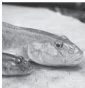
▲ハゼなどが見られるかも