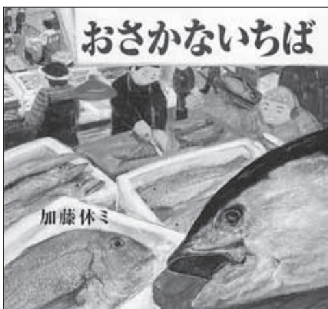
加藤休ミ/作(講談社)

■時間=午後2時~4時 ■場所=生涯学習センター(学びピア21内) ■対象=4歳以上の方 ※就学前の子どもは保護者同伴 ■内容=絵本作家・加藤休ミ氏による読み語りとワークショップ ■定員=150人(5月26日から先着順) ■申込=電話または窓口 ■申・問先=中央図書館 子ども読書推進係(5月30日(金)、6月9日(月)を除く、午前9時~午後5時)