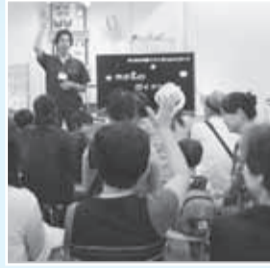
フガワの生態をスタック