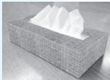
▲ガマの感触を楽しんで作ろう

■日時=6月29日(日)、午前10時～午後0時30分 ■対象=小学生以上の方 ※小学生は保護者の申し込みも必要 ■内容=ガマの刈り取り体験/ガマの葉を編んでティッシュケースをつくる ■定員=20人(抽選) ■申込=窓口または全員の住所、氏名(フリガナ)、年齢、電話・ファクス番号、「ティッシュケースをつくろう」をファクス・往復ハガキで送付 ※往復ハガキは返信面にも宛名を記入 ■期限=6月17日(火)必着