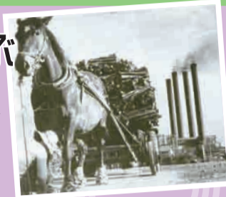
▲荷馬車とお化け煙突

平坦な土地、起伏のない道は、陸運の発展に一役買いました。近郊の農産地、工場からの運搬など、江戸時代から続く人と馬による運搬を紹介します。