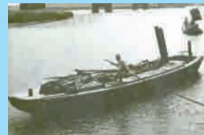
▲荒川の葛西船(下肥を運ぶ船)