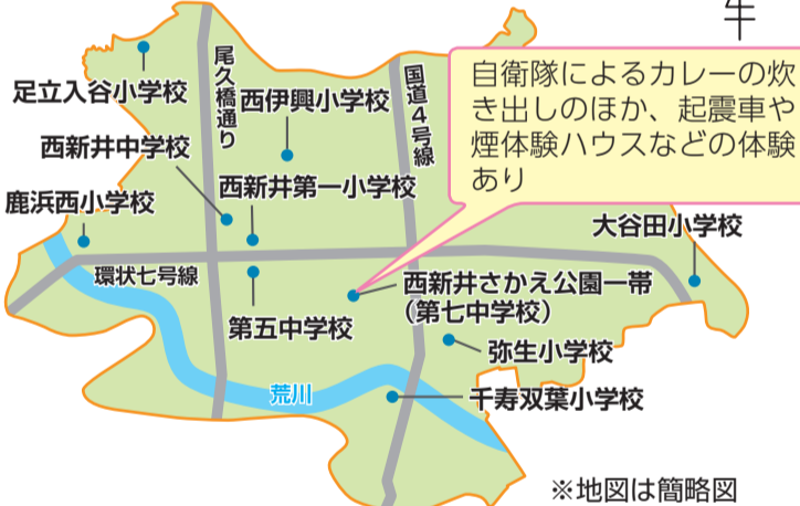
図1 当日参加可能な訓練会場

このほか区役所本庁舎、第二次(福祉)避難所、いずみ記念病院(医療救護所 本木1-3-7)、生物園・都市農業公園(動物救護所)など、区内全域で訓練を実施 ※図1の地図に記載のない施設では一般参加不可