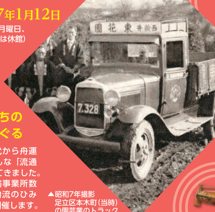
▲昭和7年撮影 足立区本木町(当時)の園芸業のトラック

南北に延びる国道4号線は、東京東郊の工業製品を運ぶ「架け橋」でした。昭和40年ごろの足立区の写真にはモノを運ぶ大小様々なトラックが写っています。