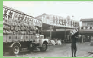
▲昭和30年代の足立市場

南北に延びる国道4号線は、東京東郊の工業製品を運ぶ「架け橋」でした。昭和40年ごろの足立区の写真にはモノを運ぶ大小様々なトラックが写っています。