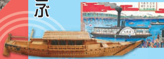
▲大同造船 川船模型を展示

海に近い江戸東京の川は、満ち潮にのって船で遊ることができました。上り・下り両方が可能な川を利用した足立区の舟運・造船に迫ります。