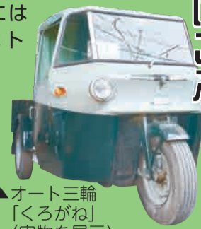
▲オート三輪「くろがね」(実物を展示)