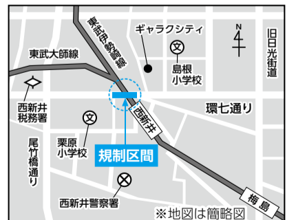
図1 環七通り規制区間

■規制期間=1月31日~29年3月■規制区間=梅島三丁目~栗原三丁目(図1)■内容=期間中、内・外回りともに2車線が1車線に減少 ※工事期間中は、環七通りの渋滞発生および周辺道路の混雑などが予想されます。迂回などのご協力をお願いします。工事の概要など、くわしくは区のホームページをご覧ください。■問先=都・第六建設事務所補修課 区・企画調整担当 ☎3882-1159 ☎3880-5160