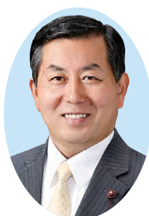
▲高山のぶゆき 議長