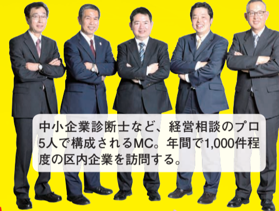
中小企業診断士など、経営相談のプロ5人で構成されるMC。年間1,000件程度の区内企業を訪問する。

中小企業が抱える、様々な悩みごとの手助けをする足立区独自の事業「マッチングクリエイター(MC)」。その活動内容をご紹介します。 ■問い合わせ先=創業支援係 ☎3870-8400