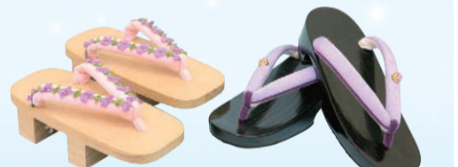
▲月に1,500足近くを手掛け、好きな柄などオーダーメイドにも対応

関原に工房を構える「はな亭」は、80年近く草履や下駄の鼻緒作りを手掛ける国内屈指の企業。生地の裁断から仕上げまで、一から手作業で行っている。機械ではできない繊細な技術が高く評価され、芸能界でも愛用されている。今年徳島県の阿波踊りで履かれる草履の鼻緒も手掛け、全国規模での更なる活躍が期待される。