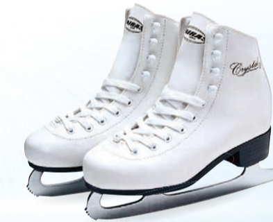
▲靴のかかと部分に芯を入れ、初心者でも滑れるよう工夫された「ZAIRAS」