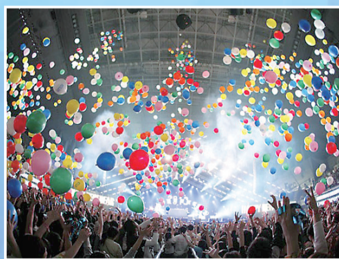
▲観客を魅了するバルーン演出