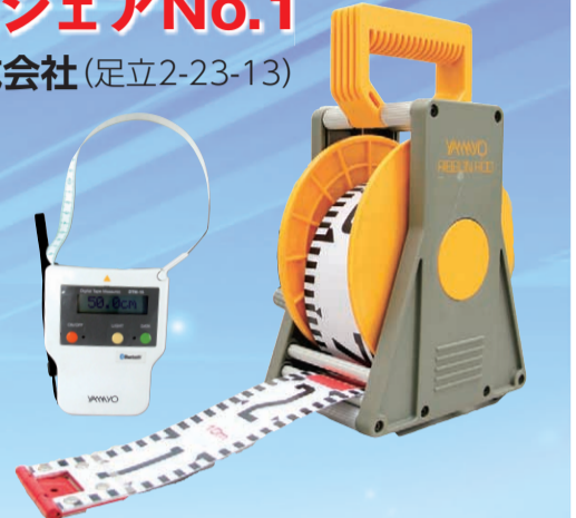
▲繊維の柔らかい特徴を生かして腹部測定用として開発された繊維製デジタル巻尺(左) / 1964年東京オリンピックでも使用されたリボンロッド(右)

巻尺を主な製品として製造・販売する「ヤマヨ測定機」は測定機という、「長さ」を測る業界で最も創業が古く伝統ある企業。100カ国以上の取引実績や、1964年に行われた東京オリンピックでも銘柄指定を受けるなど、国内外を問わずその品質が認められている。また、業界で初めて繊維製デジタル巻尺の開発にも成功した実績を持ち、2020年東京オリンピックなど、今後の活躍も期待される。