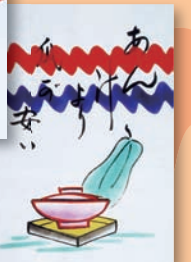
あん汁より瓜が安い(案ずるより産むが易し)