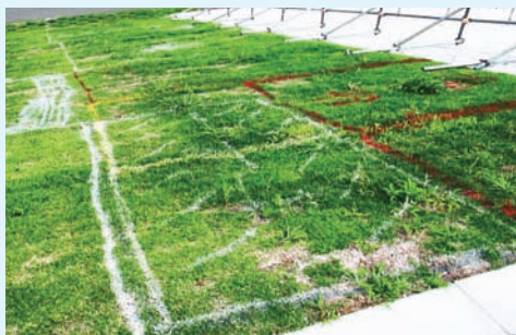
▲昨年の荒川河川敷での場所取りの様子