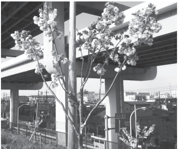
▲桜の苗木の様子(27年4月現在)

■対象=これまで五色桜に寄付したことがない個人・企業・団体 ※政治団体、宗教団体を除く ■内容=1本につき3万円の寄付で桜を植樹 ※応募は1団体(個人・企業含む)1本まで。桜の品種は選択不可。寄付をした方の名前などを掲載した銘板を設置(5年保障) ■植樹場所=荒川左岸堤防(西新井橋上流/本木一丁目地先) ※地図など、くわしくは区のホームページをご覧ください。 ■植樹本数=80本(抽選) ■申込=区のホームページ内の専用フォームに入力または住所、氏名(フリガナ)、年齢、電話番号、「平成五色桜植樹に寄付」を区へ往復ハガキで送付 ※往復ハガキは返信面にも宛名を記入 ■期限=7月31日(金)必着 ■公開抽選日時=8月4日(火)、午前10時開始 ※見学可 ■公開抽選場所=区役所庁舎ホール ■申・問先=みどり推進課 みどり事業係 ☎3880-5919