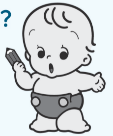
▲国勢調査キャラクター「センサスくん」

また、企業や各種団体における需要の予測や店舗の立地計画など、結果を通して様々な分野でも活用されます。