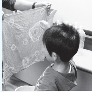
▲フンによって色がかわるよ

■日時=10月4日(日)、午後1時30分～3時30分 ■対象=小学4年生以上の方 ■内容=チョウなどのフンを使った染め物体験をしながら、生き物の食性や染色の仕組みなどを学ぶ ■定員=20人(抽選) ■費用=500円 ※別途入園料が必要 ■申込=住所、全員の氏名(フリガナ)、年齢(学年)、電話番号、「染め物体験」を往復ハガキで送付 ※返信面にも宛名を記入 ■期限=9月18日(金)必着