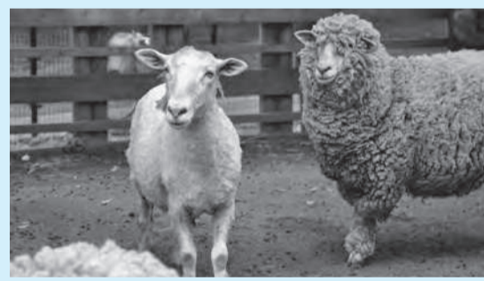
▲ヒツジも衣替えをして、夏に向けて準備

■日時=5月14日(日)、午後1時～1時30分 ■内容=夏に向けて、モコモコの毛を刈り取る様子を見学