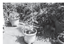
▲夏野菜を育てよう

■日時=6月4日(日)、午後1時30分～3時 ※荒天中止 ■場所=人と自然の共生館 ■内容=トマトとバジルの寄せ植えを作る ■定員=15人(抽選) ■費用=1,000円 ■期限=5月22日(月)必着