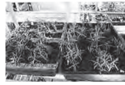
▲園芸の技術や知識を学ぼう

■日時=6月11日(日)、午後1時30分～3時 ※荒天中止 ■場所=人と自然の共生館 ■内容=花後の剪定と、切った枝を利用した挿し芽を作る ■定員=15人(抽選) ■費用=500円 ■期限=5月29日(月)必着