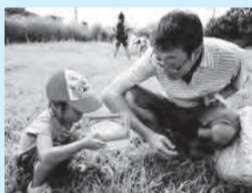
▲元気なバッタを見つけた!

■日時=6月11日(日)、午前10時30分～11時30分 ■対象=就学前の子どもと保護者 ■内容=園内でバッタを探して触れ合い、バッタになりきって遊ぶ ■定員=20人(抽選) ■申込=窓口または全員の住所・氏名(フリガナ)・年齢・電話番号・ファクス番号、「ちびっこ自然体験6月11日」をファクス・往復ハガキで送付 ※往復ハガキは返信面にも宛名を記入 ■期限=5月30日(火)必着