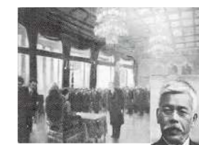
▲御下問を受ける笠井知事