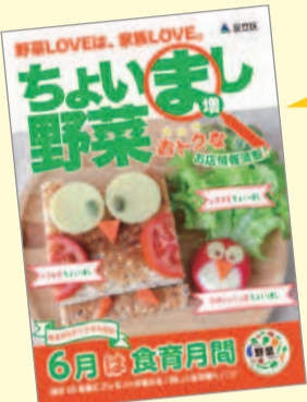
▲協力店スペシャル企画や料理教室などの一覧を掲載(写真はイメージ)

お得で楽しい特別企画・イベントはリーフレットをチェック! ■配布場所=こころとからだの健康づくり課/保健センター/地域学習センター/ギャラクシティなど ※5月25日ごろ配布開始