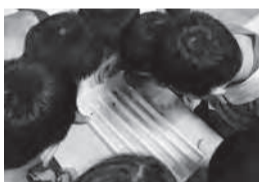
▲どのダンゴムシが1番かな?

■日時=5月21日(日)、6月4日(日)、午後2時～2時30分 ■内容=「ダンゴムシレース」など、自然を楽しむ2つのプログラムの中から好きなものを選んで挑戦する ※就学前の子どもは保護者同伴 ■申込=不要 ※当日直接会場へ