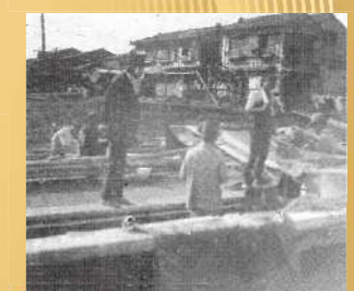
▲1928(昭和3)年 水上生活者調査