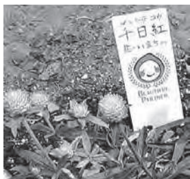
▲プレートには花の名前などを書くことができます