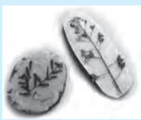
▲荒川の野草でブローチを作ろう

■日時等=5月20日(土)、午前10時～正午 ※時間内に4回実施。午前9時45分受け付け開始 ■場所=生涯学習センター・4階講堂ロビー(学びピア21内) ■内容=押し花と樹脂(レジン)でアクセサリーを作る ■定員=各10人(先着順)