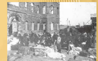
▲1923(大正12)年 関東大震災慰問品の配給