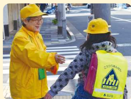
▲通学路で見守り・声かけを行います

すべての民生委員は児童委員を兼ねていて、その中には児童福祉に関する専門的な担当する主任児童委員がいます。いずれもいじめ・不登校問題や児童虐待の早期発見・対応に向けて学校や児童相談所と連携し、子育て家庭の見守りや相談支援に取り組んでいます。そのほか日ごろからの登下校時の見守りや学校行事への参加など、活動は多岐に渡ります。