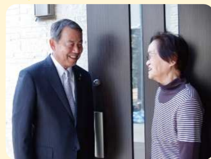
▲地区担当者が訪問します

「高齢で一人暮らしが不安」「隣のおじいちゃんが元気か見に来てほしい」など、相談される内容は千差万別。相談や調査などで、実に年間3万4,834件(1人あたり約64件、27年度実績)の訪問を行っています。夏には熱中症予防のために高齢者のお宅へ訪問して水分摂取を呼びかけるなど、地域の安全・安心のために年間を通して活動しています。