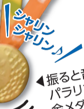
振ると音が鳴るパラリンピック金メダル

スポーツは障がいのある人もない人も、誰もが楽しめ、知らない人とでもすぐに打ち解けることができる強い力を持っています。足立区の皆さんも私たちと一緒にスポーツを通して、みんながともに活動できる「共生社会」をめざしていきましょう。