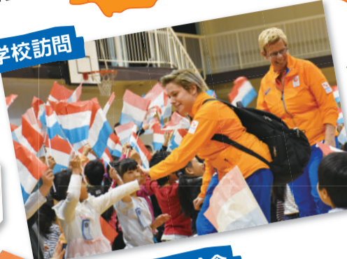
◀子どもたちも大歓迎