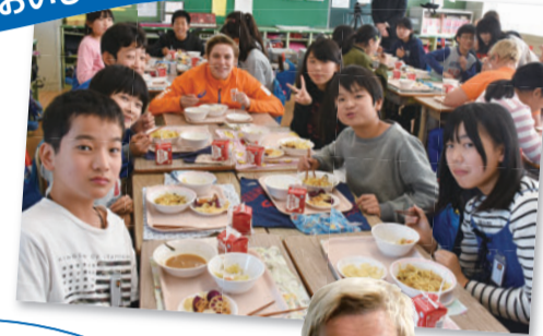
◀一緒におしゃべりを楽しむ