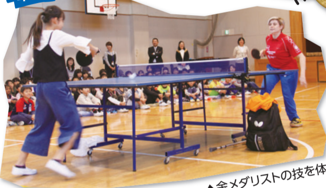
▲金メダリストの技を体感