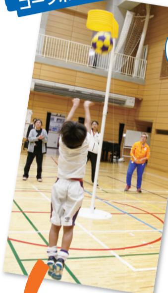
コーフボールを体験するなら...