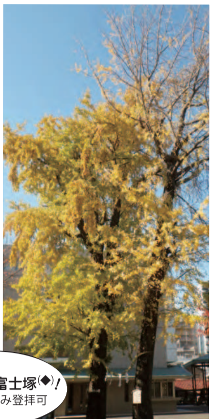
◆…富士山を模した人工の山や塚