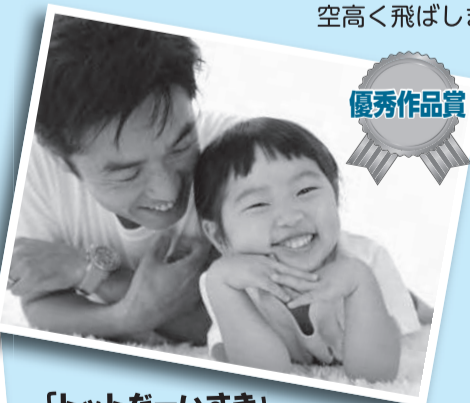
「トットだーいすき」 よく泣く娘も二人目の出産のときは泣かずにとってもいい子にトット(お父さん)とお留守番できたことに感動しました。