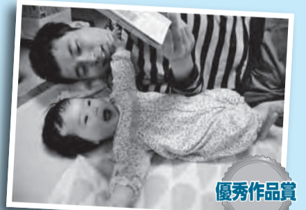
「パパの読み聞かせ」 パパが毎日絵本を読んでくれたので、絵本が大好きな娘に育ちました。