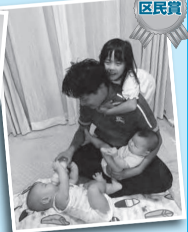
「夫婦助け合いの子育て」 土・日曜日は子どもたちのお世話をパパにお任せ。