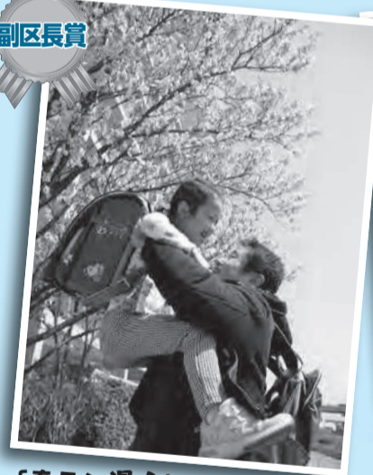
「春ラン漫♪」 新しいランドセルにウキウキの子どもを抱っこし、顔がほころんでしまうパパ。