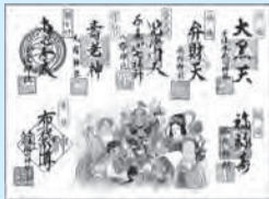
▲千支入り七福神色紙 (334mm×242mm)

■期間=31年1月1日～7日、午前9時～午後4時 ■費用=▷色紙(宝ぶね・千支入り七福神)…各2,000円 ▷御朱印…200円(御朱印帳への押印は300円) ※いずれも各神社で販売。マップは各神社、北千住駅、千住街の駅、北千住駅西口交番、(一助)足立区観光交流協会などで配布