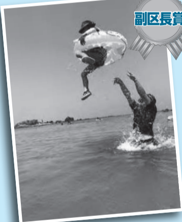
「3.2.1.大ジャンプ!!」 ゴーグルをつけて潜り、空高く飛ばしました。