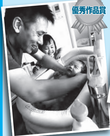
「お風呂楽しいな」 3カ月の育休を取り、育児・家事に奮闘しました。