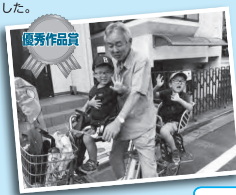
「出発進行!!」 いつも保育園の送迎をしてくれるジジの自転車が大好きな子どもたち!