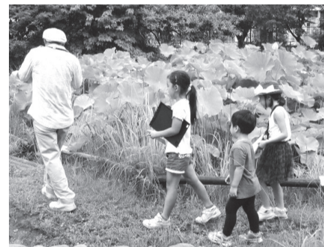
▲ハス田にはどんな生きものがいるかな?

■日時=8月2日(日)・9日(日)・10日(祝)、午後2時～2時30分 ■内容=「池のミニ水族館」と「ハス田探検」から好きな方を選んで挑戦 ※雨天の場合は別のプログラムに変更。就学前の子どもは保護者の参加が必要 ■申込=不要 ※時間内随時受け付け