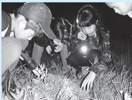
▲夜の荒川で生きものを探そう

■日時=8月29日(土)、午後6時30分～8時 ■場所=荒川ビジターセンター/荒川河川敷・わんど広場 ■内容=夜の河川敷で生きものを探して観察する ■定員=10人(抽選) ※小学生以下の方は保護者の参加が必要 ■申込=全員の住所・氏名(フリガナ)・年齢・電話番号、「夜のわんど観察会」を往復ハガキで送付 ※返信面にも宛名を記入。1通で5人まで。1人1回のみ申し込み可 ■期限=8月13日(木)必着