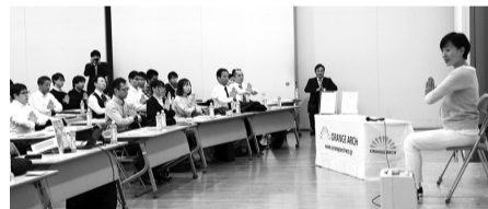
▲ヨガインストラクターによる「座ってできる肩こり・腰痛体操」を実施