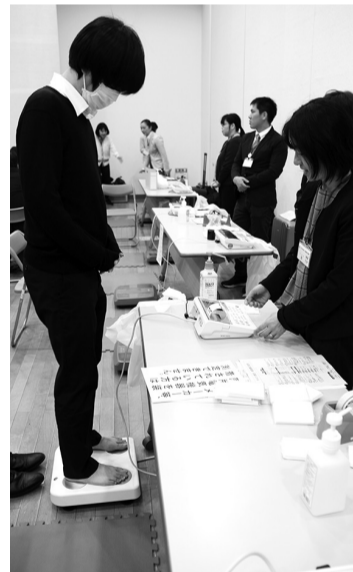
▲カラダ測定会を行い、区の保健師が結果の見方を解説