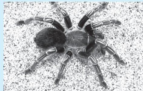
▲タランチュラの怖い毒には理由がある!

■期間=開催中～9月22日 ■内容=毒を持つ生きものたちの形態・生態の多様性や生存戦略を紹介 ※入園料が必要 ■申込=不要 ※当日直接会場へ