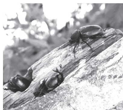
▲間近でじっくり観察してみよう

■日時=8月2日(日)、午後2時30分～3時 ※雨天中止 ■内容=夏に発生ピークとなる、カブトムシなどの樹液に集まる虫を、昆虫ドーム内で観察する ※入園料が必要 ■定員=15人(先着順) ■申込=不要 ※当日午前9時30分から会場で受け付け