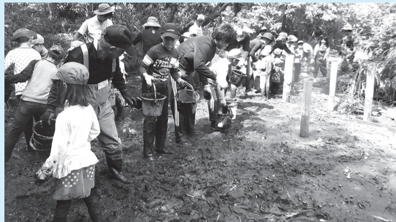
▲みんなで生きものが住みやすい池にしよう

■日時=9月6日(日)、午前10時～正午 ※荒天の場合は13日(日)に延期 ■対象=小学生以上の方 ※小学1・2年生は保護者の参加が必要 ■内容=水を抜いた池に入り、網を使った生きものとりや、ヘド口のかき出しを体験 ■定員=50人(抽選) ■申込=窓口/全員の住所・氏名(フリガナ)・年齢・電話番号・ファクス番号、「かい掘り体験」をファクス・往復ハガキで送付 ※往復ハガキは返信面にも宛名を記入。1人1回のみ申し込み可 ■期限=8月25日(水)必着