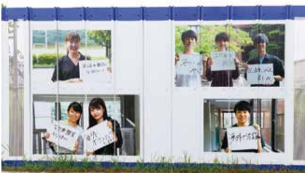
▲仮囲いには、来春から足立区へ通う学生たちの写真と、夢を込めたメッセージが並んでいる(写真は国際学部)

花畑五丁目に建設中で、「地域・社会との“和”」「人と人との対“話”」「人と環境にやさしい循“環”」という3つの“わ”をデザインすることがコンセプト。