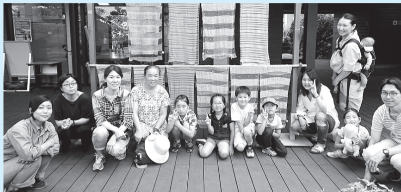
▲どんな模様になるかはお楽しみ

■日時=8月30日(日)、午前10時～午後3時 ■対象=4歳以上の方 ※小学3年生以下の方は保護者同伴 ■内容=畑での野菜収穫体験/藍を使った染色体験 ■定員=10人(抽選) ■費用=3,300円(材料費・昼食代) ※親子は4,500円 ■期限=8月19日(水)必着