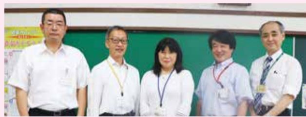
▲花畑地区(左から桜花・花畑・花畑第一・花保・花畑西小学校)の校長先生たち

文教大学の皆さん、花畑地区へようこそ！花畑地区に大学が来るということで、学校の子どもたちも先生たちも、そして地域の皆さんも大変うれしく思っています。お互いの力を結集して、足立区をより発展させていきましょう！