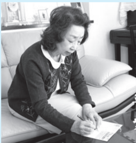
▲1枚ずつ想いを込めて書いたハガキを送付

ご 主人を亡くした女性を訪問した際、「民生委員なんて知らないわよ」と怒鳴られたことがありました。それでも、何度も訪問していくうちに仲良くなって、一緒に食事をするまでになったのですが、ある日突然亡くなってしまいました。それは、今でも鮮明に覚えているほど、ショックを受けた出来事でした。でも、つらいときに誰かと話げできたことで、その方