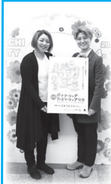
▲戸籍住民課で証明書を受けとった2人

★1…戸籍上同一の性の方、または戸籍上の性に関わらず、自らが認識する性が同一の方など、人生のパートナーとして生活を共にすると約束した2人に、宣誓書受領証明書などを発行