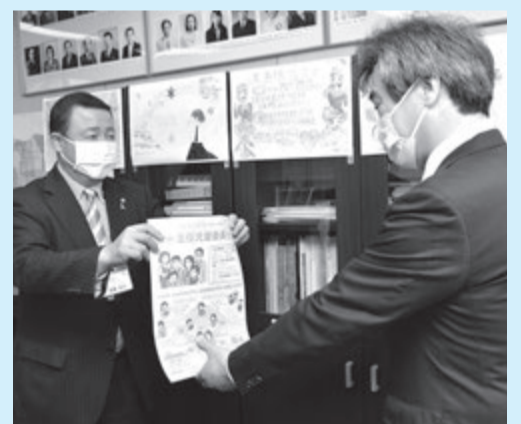
▲手作りのポスターを直接届けに学校などを訪問(東島根中学校)

以 前、不登校の女子生徒を女性の保健師につないだら、妊娠していたということがありました。少し遅ければ命の危険もありました。家族や友人、学校などには相談しづらいこともあると思います。ましてコロナ禍で人になかなか会えない状況です。ぜひ我々を頼ってください。「相談できる相手につなぐ」ことも、地域の様々な方とのパイプを持っている私たちの役割です。私たちは「つらい思いをしている方を一人でも減らしたい」という気持ちで活動しています。