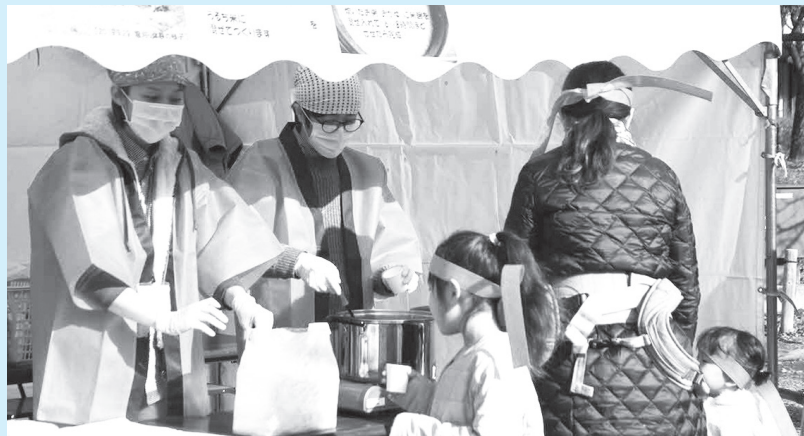
▲ほんのり甘い甘酒で体を温めよう

■日時=5年1月2日(休)、午前10時~正午 ■内容=米麹から作られた甘酒を配布 ※なくなり次第終了 ■申込=不要 ※当日直接会場へ