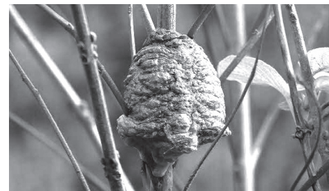
▲カマキリの卵はどんなところにあるかな?

■日時=5年1月9日(祝)・15日(日)、午後2時~2時30分 ■内容=「冬ごしの生きものさがし」と「カマキリのたまごさがし」から好きな方を選んで挑戦 ※雨天時は別のプログラムに変更 ■申込=不要 ※時間内随時受け付け