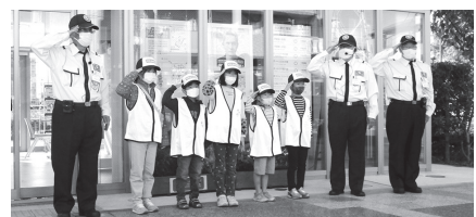
▲あなたも「ろくまる隊員」になろう!

■日時=5年1月21日(土)、午前10 時～11時30分 ■場所=六町駅前 安全安心ステーション ■対象=区 内在住の小学1～3年生 ※保護者 同伴 ■内容=防犯講話/勤務体験 /周辺パトロール など ■定員=5 人(抽選) ■申込=区のホームペ ージからオンライン申請 ■期限=5 年1月6日(金) ■申・問先=生活安全 推進担当 ☎3880-5838