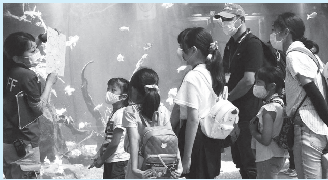
◀君は何問正解できるかな?

■日時=5年1月6日(金)~9日(祝) 午前9時30分~午後3時30分 ※受け付けは3時まで ■対象=小学生 ■内容=園内各所で生きものに関するクイズラリーに挑戦 ※参加賞あり