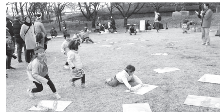
▲お正月は巨大カルタで遊ぼう

■日時=5年1月2日(休)、午前9時45分~10時30分/11時15分~正午 ※雨天中止 ■内容=都市農オリジナルの巨大カルタで遊ぶ ■定員=各20人(先着順) ■申込=不要 ※当日午前9時から会場を受け付け