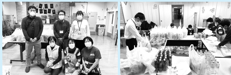
▲スタッフで協力しながら運営

ファミリーマートと協定を締結し、フードドライブの提供を受けて活動中。ひとり親世帯や生活困窮世帯など、約30世帯の方に毎月配布しています。