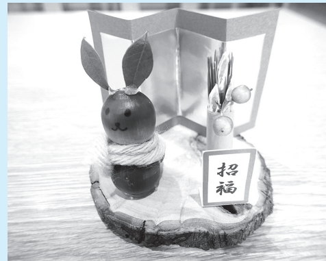
▲自分だけの置き物を作ろう!

■日時=5年1月8日(日)、午前10時~11時/午後2時~3時 ■内容=木の実を使って新年の干支「卯(うさぎ)」の置き物を作る ■定員=各10人(先着順) ■費用=100円(材料費) ■申込=不要 ※当日午前9時から会場に参加証を配布