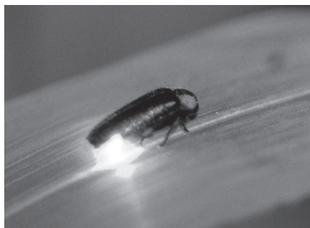
▲ホタルの美しい光で新年を迎えよう!

■日時=5年1月2日(休)~5日(休)、午後1時~4時 ※20分ごとに10回実施 ■内容=ヘイケボタルの幻想的な光を楽しむ ※生体の状況により中止する場合があります ■定員=各20人(先着順) ※就学前の子どもは保護者同伴