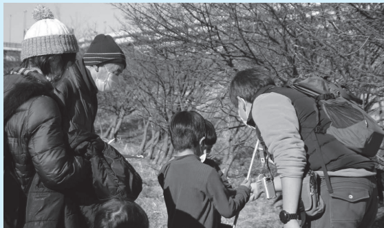
▲新年の最初に見つけられる生きものは何かな?

■日時=5年1月8日(日)、午前10時~11時30分 ■場所=荒川河川敷・わんど広場 ■内容=河川敷をゆっくり歩きながら生きものを観察する ■定員=20人(先着順) ※就学前の子どもは保護者の参加が必要 ■申込=不要 ※当日午前9時から荒川ビジターセンターで参加証を配布