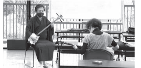
▲2月から始まる連続講座のお試し入門編

■日時=1月20日(金)・27日(金)、午前11時～午後0時15分 ■対象=16歳以上の方 ■内容=初めて三味線を触る方に向けた教室 ■定員=各15人(1月2日から先着順) ■費用=1,800円(授業料。三味線レンタル代含む) ■申込=電話/窓口/住所、氏名(フリガナ)、年齢、電話・ファクス番号、希望日、「三味線教室(お試し)」をファクス ■期限=開催日前日 ■場・申・問先=都市農業公園 ☎3853-4114 FAX3853-3729