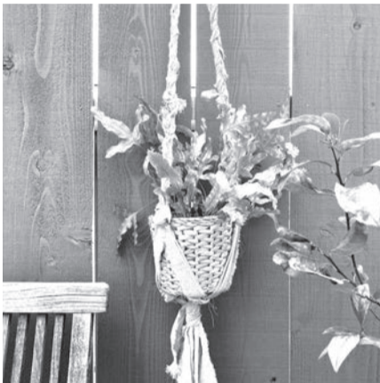
▲作品はお持ち帰りになれます

■日時=2月18日(土)、午後2時~4時 ■対象=区内在住・在勤・在学の方 ■内容=古布を使って、植木鉢を吊るすプラントハンガーを作り、観葉植物を入れる ■定員=10人(1月11日から先着順) ■費用=1,000円 ■申込=電話/窓口/住所、氏名、電話番号、「プラントハンガー」をファクス ※1人1回のみ申し込み可 ■場・申・問先=あだち再生館(月曜日、祝日休館) ☎3880-9800 FAX3880-9801