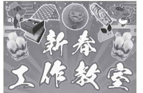
▲門松やおみくじのおもちゃを作ってみよう!

■期間=1月2日～9日 ■時間=午前10時～正午/午後1時30分～4時 ■内容=身近な素材を使って、お正月にちなんだ飾りやおもちゃを作る ■定員=各10組(1組1家族まで。随時入れ替え) ※就学前の子どもは保護者同伴 ■申込=不要 ※当日直接会場へ ■場・問先=ギャラクシティ ☎5242-8161