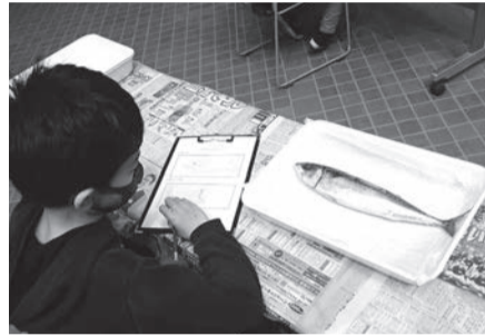
▲魚のからだのつくりとはたらきを学ぼう

時30分 ■対象=小学4～6年生 ■内容=魚を解剖して、魚類の形態や内臓などの秘密に迫る ■定員=5組(1組2人まで。抽選) ※1人での参加可 ■費用=1人2,000円 ※別途入園料が必要 ■申込=全員の住所・氏名(フリガナ)・年齢(学年)・電話番号、「サカナの研究会」を往復ハガキで送付 ※返信面にも宛名を記入。1人1回のみ申し込み可 ■期限=1月12日(木)必着 ■場・申・問先=生物園 〒121-0064 保木間2-17-1 ☎3884-5577