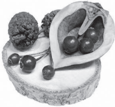
▲接着剤を使って自由に飾りつけよう!

2時30分/3時～3時30分 ■内容=切った木の枝に草や木の実を飾りつけてマグネットを作る ■定員=各10人(抽選) ※就学前の子どもは保護者の参加が必要 ■申込=全員の住所・氏名(フリガナ)・年齢・電話番号、希望時間、「剪定枝マグネットづくり」を往復ハガキで送付 ※返信面にも宛名を記入。1通で5人まで。1人1回のみ申し込み可 ■期限=2月3日(金)必着 ■場・申・問先=荒川ビジターセンター 〒120-0034千住5-13-5 学びピア21・4階 ☎5813-3753