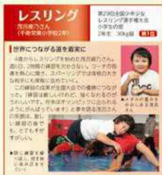
▲平成25年のあだち広報に登場。「強くなれるのがうれしい」と笑顔で喜びを語った

この度は児童・生徒褒賞の受賞、誠にありがとうございます。私の生まれ育った区に、様々な分野で活躍している後輩たちがいると思うとうれしい気持ちでいっぱいです。私が受賞した当時は、「何が何でも大会で優勝するぞ」という気持ちを持ち続け、友だちと遊ぶ時間も惜しみ、休日は他県まで稽古へ行くなど、勝ちにこだわって努力する日々を過ごしていました。