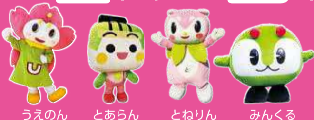
うえのん とあらん とねりん みんくる

※当日は近隣の駐車場が混み合いますので、公共交通機関をご利用ください。開催期間中に主催者が実施する新型コロナウイルス感染症対策にご協力ください。