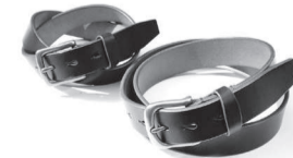
▲海外からも評価を得ている栃木レザーを使用した「革ベルト」

革製品の製造・販売や、栃木レザー皮革の販売を行う。また、千住の店舗兼工房で自社ブランド「minca」を展開しながら、警察装備品を開発・製造している。材料にこだわり、革や部位ごとの特性をじっくり見極め、それぞれに合った製品に仕上げている。