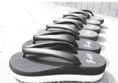
▲洋装にも合わせやすい「ボンダル」

大正13年の創業以来、親子3代にわたり鼻緒を製造している。はな壱最大の特徴は、足に優しい痛くない鼻緒。3代目が「見た目は和装履物、履き心地はスニーカー」をコンセプトに、洋装にも合う鼻緒付き履物「ボンダル」を開発。都内唯一の鼻緒職人の手仕事が光る。