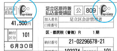
▲納付書の中央上部に掲載あり