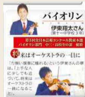
▲平成24年のあだち広報に登場。「将来はオーケストラの一員になりたい」と語っていた

皆さんにお伝えしたいことは、とにかく様々なチャレンジをして経験を増やしてほしいということです。自分の目標や夢と関わりがなさそうなことだとしても、いずれその経験が自分のものに還ってくると思います。ぜひ広い視野で物事を捉えて、何事にも全力で取り組んでみてください。