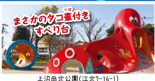
まさかのタコ壺付き すべり台