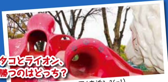
タコとライオン、 勝つのはどっち?