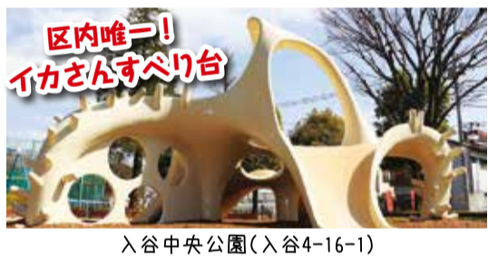
区内唯一! イカさんすべり台

現在、区内には10基*のタコさんすべり台があります。なかでも新西新井公園にあるタコさんすべり台は、昭和40(1965)年からあり、なんと、全国で「第1号」ではないか、とされているんです(諸説あり)。あなたの「イチオシ」タコさんを、見つけてください! ■問先=お問い合わせコールあだち(毎日、午前8時~午後8時) ☎3880-0039