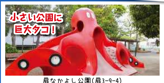
小さい公園に 巨大タコ!