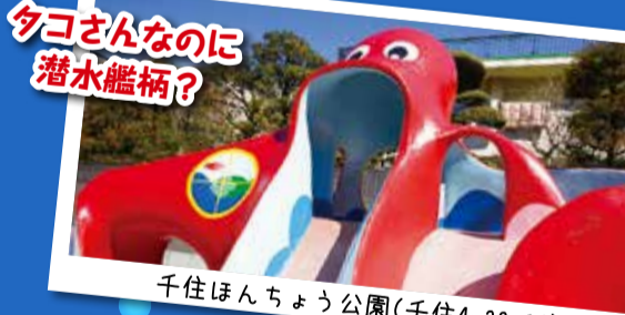
タコさんなのに 潜水艦柄?