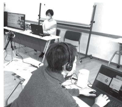
▲薬膳講座で健康に、食を楽しく!

めまい、ほてりなど、更年期特有の症状にお困りの方の体調管理に役立つ薬膳の知識とおすすめレシピを教えます。YouTubeでの後日配信(6月22日、午前9時～7月7日、午前9時)でも受講可能です。