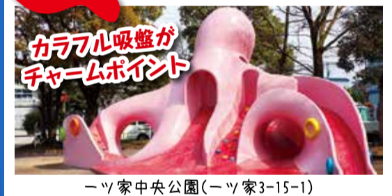
カラフル吸盤が チャームポイント