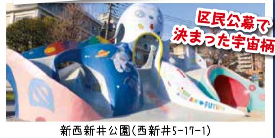
区民公募で 決まった宇宙柄!