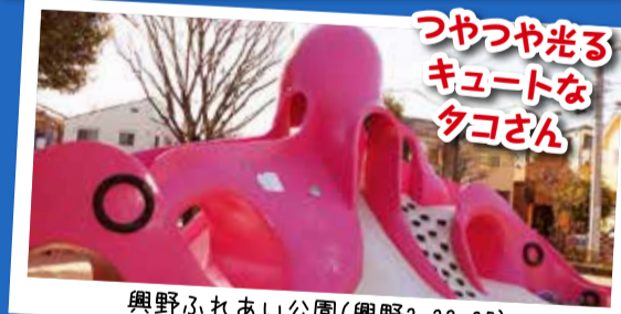
つやつや光る キュートな タコさん