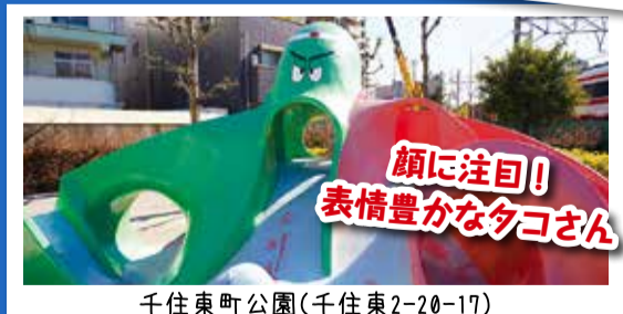
顔に注目! 表情豊かなタコさん