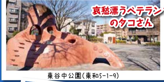
哀愁漂うベテラン? のタコさん