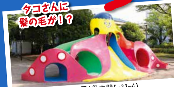
タコさんに 髪の毛が!?