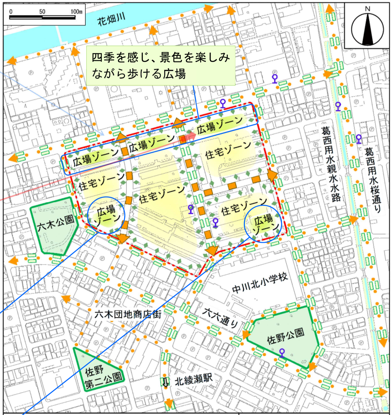
この地図は、東京都縮尺2,500分の1地形図を利用して作成したものである。 (承認番号) (MMT利許第05-121号) (承認番号) 5都市基街都第229号、令和5年11月2日