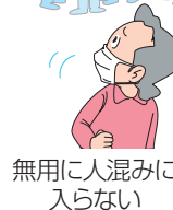
無用 に人混み に入らない