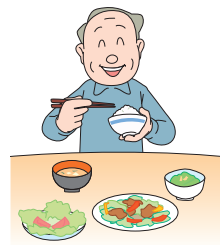
十分な休養と バランスのとれた栄養