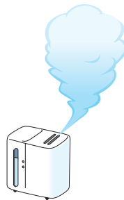
部屋の 適度な湿度

インフルエンザは、主に、咳やくしゃみの際に口から発生する小さな水滴（飛沫）によって感染します（飛沫感染）。普段から“咳エチケット”（①他の人に向けて咳やくしゃみをしない、②咳やくしゃみが出るときはマスクをする、③手のひらで咳やくしゃみを受け止めたら手を洗うことなど）を心がけてください。