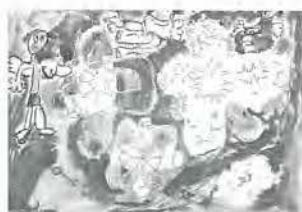
扇小 2年 松本一馬