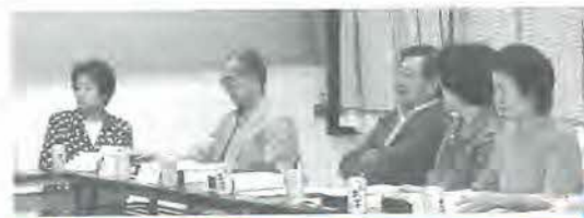
(大久保 義子 記)

題」とのお話がありました。その後、青少年副部長から「地域と学校の連携が密で活動がうまく行く」との意見があり、和やかに閉会いたしました。