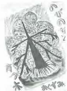
鹿浜第一小 6年 奥墨 彩