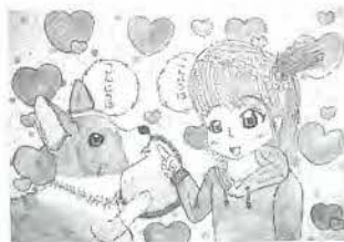
高野小 5年 中村 優