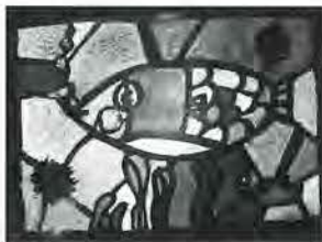
新田小 6年 奥山菜葉