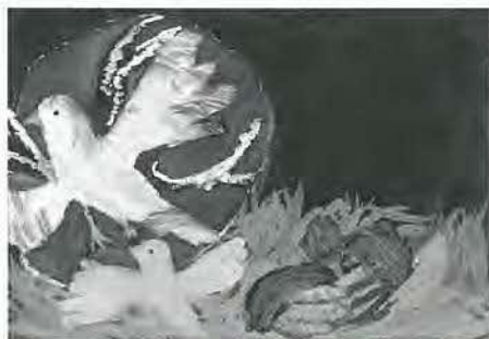
平野小5年 須藤秀平 作

地域密着型サービスとして「小規模多機能型居宅介護」があります。グループホームとは異なるサービスです。平成20年11月に誕生した小規模多機能型居宅介護「じゃすみんの家」で、お話をうかがいました。