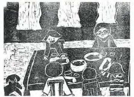
東栗原小5年 勝田雛子 作