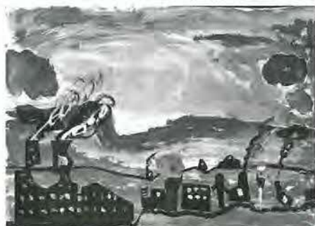
千寿小3年 壘 隆貴 作