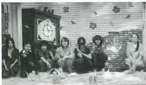
完成したシャッターアート絵を背景に

私は千住旭町商店街（学園通り）の時計屋さんのシャッターを描くことになりました。チームのみんなと