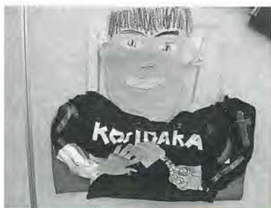
鹿浜小3年 腰高潤平 作