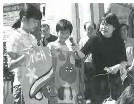
商店街のイベントで先生と生徒で 手描き旗のお披露目

とに満足している様子です。家族で見てもわっているお友達もいました。商店街の企画が地域に生きる子どもたちの夢と希望を与えるばかりでなく子どもたちも商店街に愛着をもち、郷土への誇りをもつようになるのではないかと考えています。そして毎年続けていくことの大切さもかみしめています。