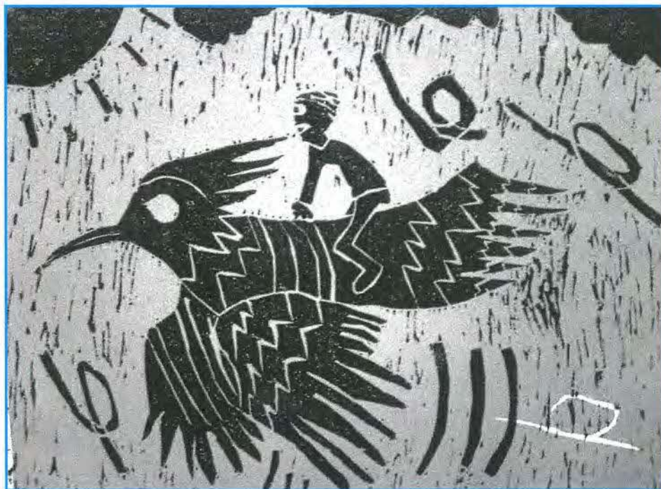
関原小5年 榎本 翼 作

足立区民生・児童委員協議会 会 長 中田貢弘 編 集 広報部会 発 行 日 2007年7月1日 〒120-8510 足立区中央本町1-17-1