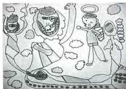
興本小4年 高橋佑真 作