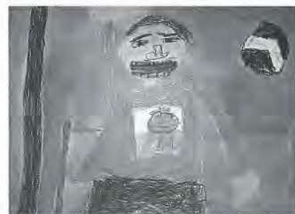
関原小4年 守田尚矢 作