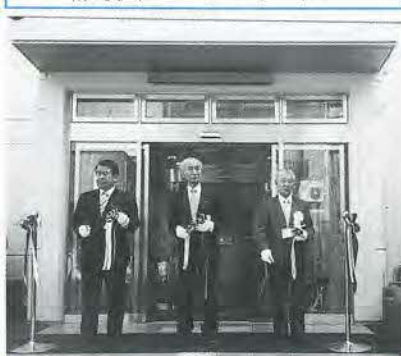
区長・議長らによるテープカット

永きにわたり利用され千住西地域にあった老人館児童館、北部集会所、竜田町施設が3月で閉館となりました。それに伴い新しく4月1日に千住柳町住区センターがオープンしました。足立区で47番目の住区センターで、年配者から幼児まで三世代がふれあえる場にしていこうと、部会の中に民生・児童委員、主任児童委員も参加しています。また双葉小学校も本年度