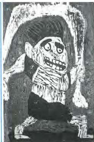
寺地小五年 今野智也 作