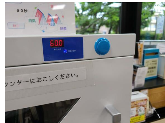
③ ドアを閉め、右上にあるスタートボタンを押します（タイマーに作業完了までの時間が表示されます）。