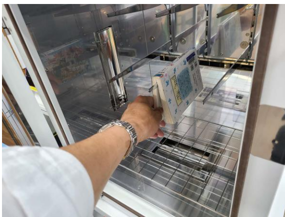
④ 約60秒後、除菌が完了します。本を取り出し、ドアを静かに閉めてください。