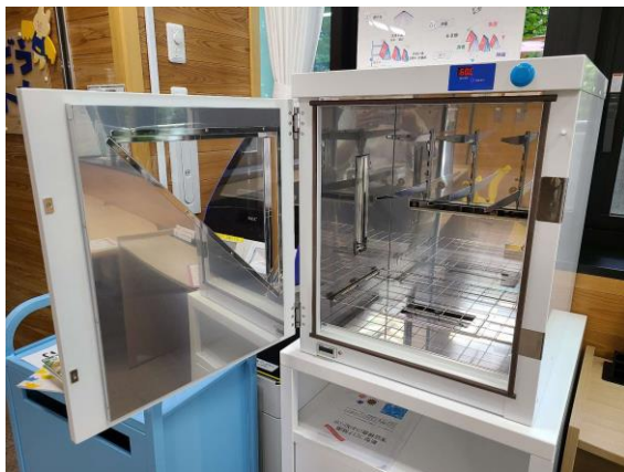
① 除菌機のドアを開けます。