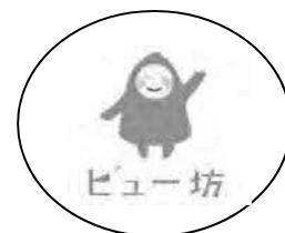
イメージキャラクター「ビュー坊」

※「ビューティフル・ウィンドウズ運動」とは、「美しいまち」を印象付けることで犯罪を抑止しようという足立区独自の運動です。区は、警視庁や区民のみなさんと協働して、まちの美化活動や防犯パトロールなどの取り組みを推進し、犯罪のない住みよいまちの実現をめざしています。