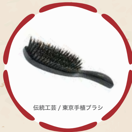
伝統工芸 / 東京手植ブラシ