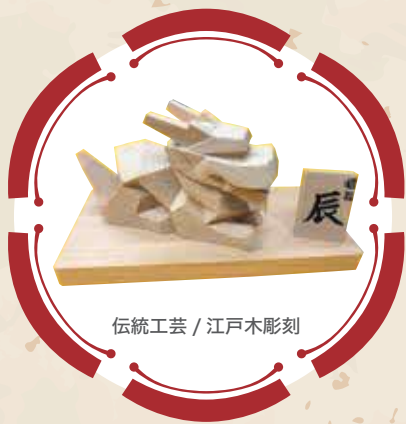
伝統工芸 / 江戸木彫刻