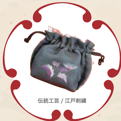
伝統工芸 / 江戸刺繍