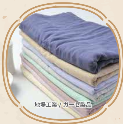
地場工業 / ガーゼ製品