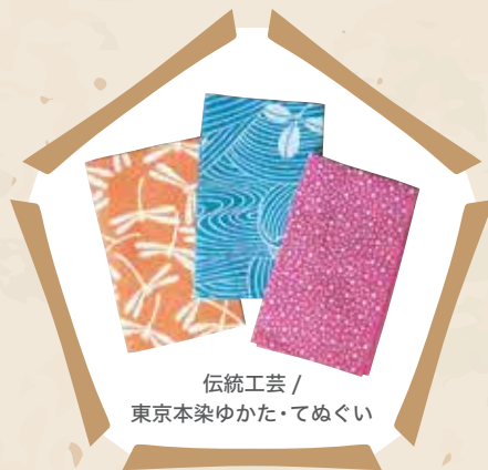
伝統工芸 / 東京本染ゆかた・てぬぐい