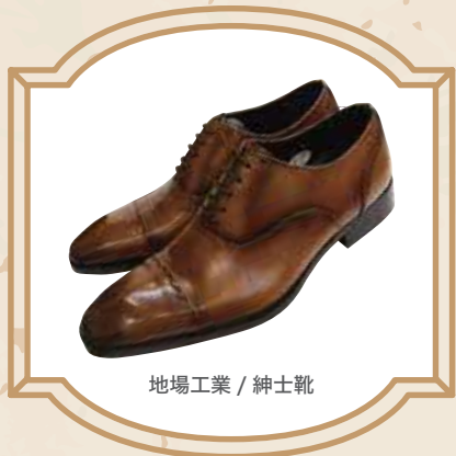
地場工業 / 紳士靴