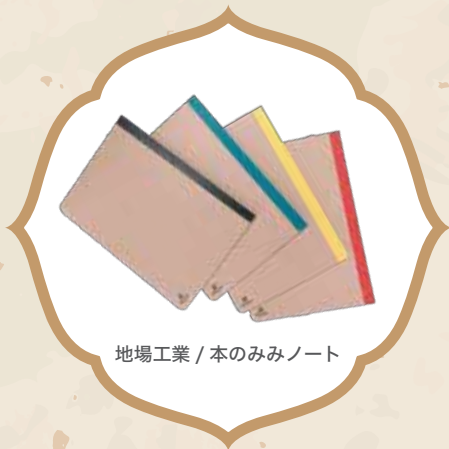
地場工業 / 本のみみノート