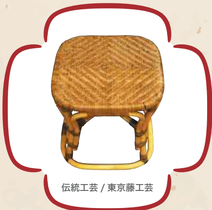
伝統工芸 / 東京藤工芸