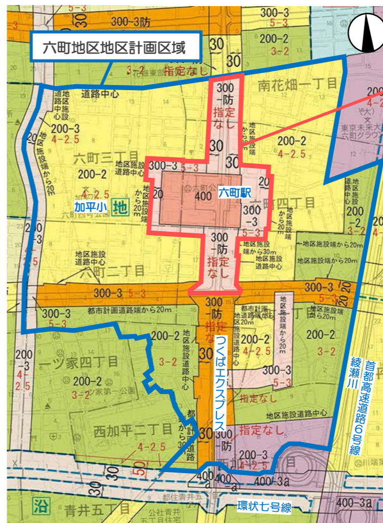
＜六町地区の用途地域等指定図＞

※1 3ページ Q5 参照 ※2 建築基準法 59 条の2 に基づくもの ※3 3ページ Q4 参照