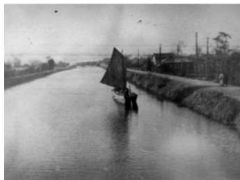
◎昭和10年頃の綾瀬川に浮かぶ帆かけ船

昭和55年以降、水質が15年連続全国ワースト1となった綾瀬川。現在は水質が劇的に改善しました。その綾瀬川の今の姿を展示します。