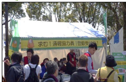
◎当日はブースに収まらないほどの大盛況でした!