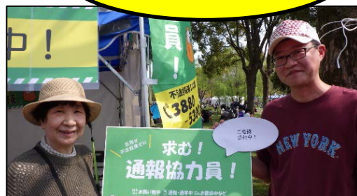
◎1,000人目の会員の方へ、記念に写真とプレゼントを贈呈しました!

ブースにはたくさんの方がお越しくださり、2日間で432名の方にご登録いただきました。その結果、延べ登録者数は1,077名(令和元年5月17日現在)となりました。前号でご案内の通報協力員紹介キャンペーンも好評で、「防犯に役立つものがもらえた!」「家族みんなで協力します!」との声が聞かれました。2日間、盛況のうちに終了することができ、ありがとうございました!