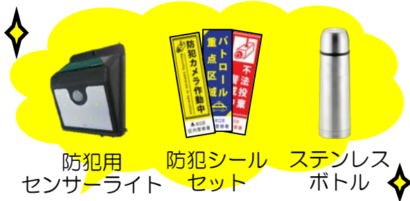
防犯用 センサーライト