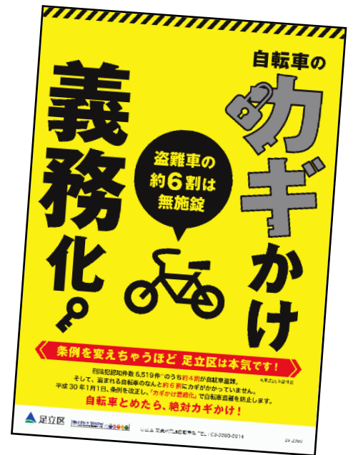
▲ 自転車のカギかけ義務化のポスター