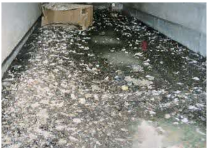
▲アパート通路のよごれ