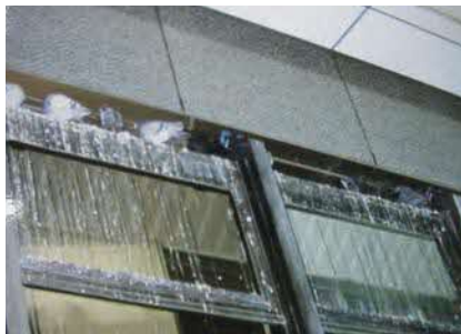
▲ビルの窓のよごれ