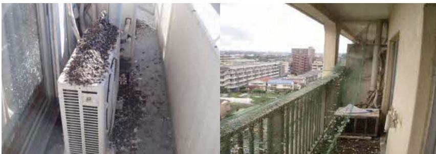
▲マンションベランダのよごれ