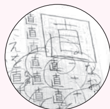
▲授業のノートや友だちへの手紙なども丁寧に書くように心がけています。

書写書道教室をしている祖母の影響で2歳から始めた硬筆。満足のいく作品を完成させるため、大会前になると普段の練習に加え、大会の課題を1枚1枚丁寧に練習します。最近替えたばかりの硬筆用の下敷きはすでに黒くなり、懸命に練習に打ち込む姿が目には浮かびます。また、授業用のすべてのノート丁寧に書くように意識しており、「このノートは捨てられない」と、お母さんは大切に保管しています。普段から丁寧に書くことで、後で見返しても理解しやすいので、忘れ物防止にも役立ちます。