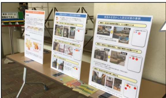
シールが貼られたパネル