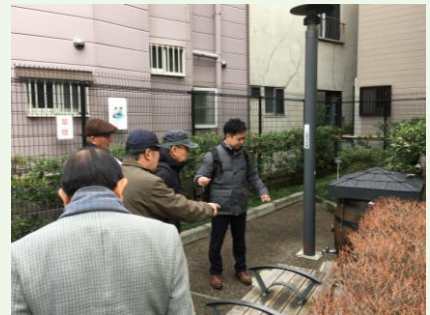
プチテラスの防災設備を見学