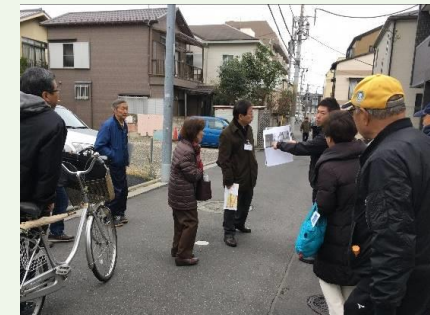
拡幅された道路を見学

「地震に関する地域危険度測定調査」をきっかけに勉強会を発足、協議会に発展しました。防災まちづくりの事業で整備されたプチテラスや道路を見学しました。