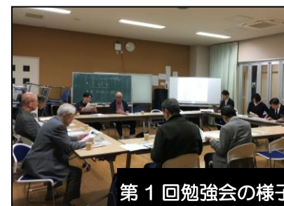
第 1 回勉強会の様子