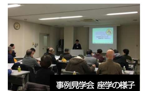
事例見学会 座学の様子