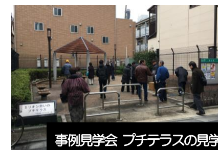
事例見学会 プチテラスの見学