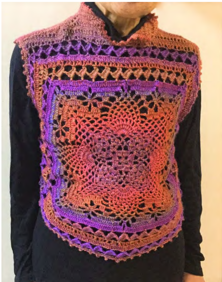
ベスト さっちゃん