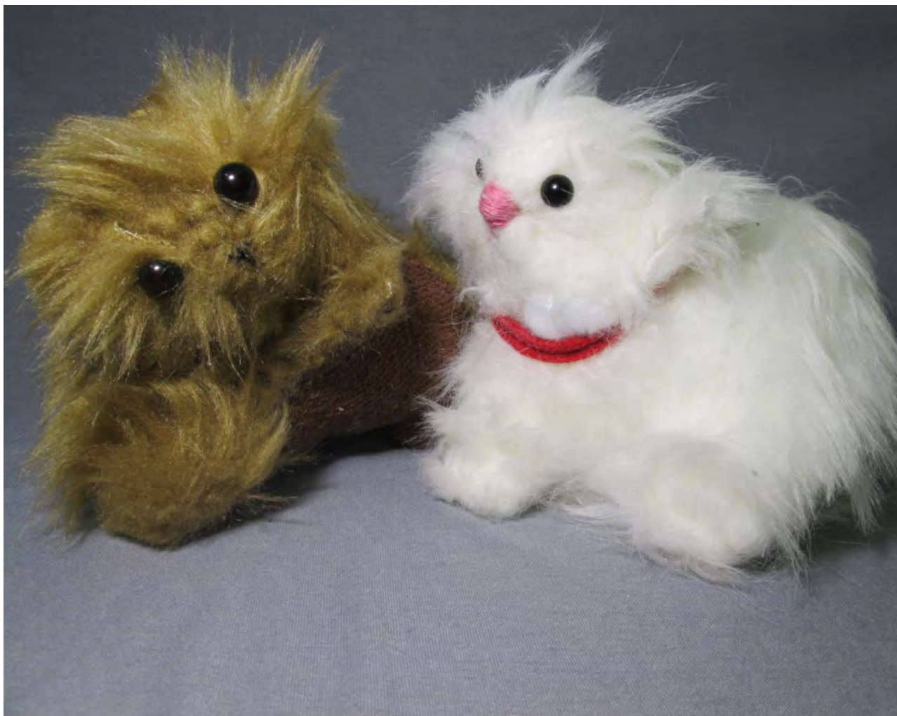
手芸作品 空気読めない君