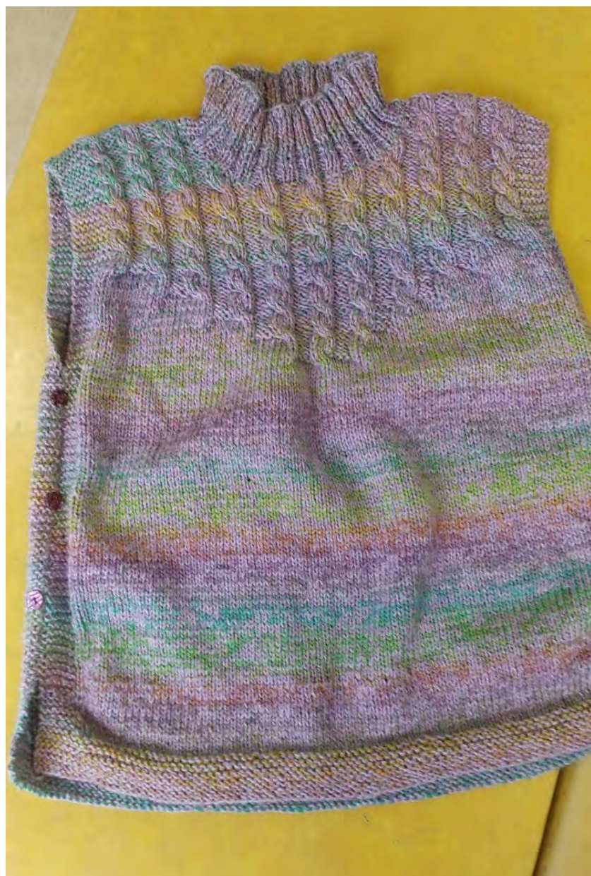
ベスト よしえちゃん