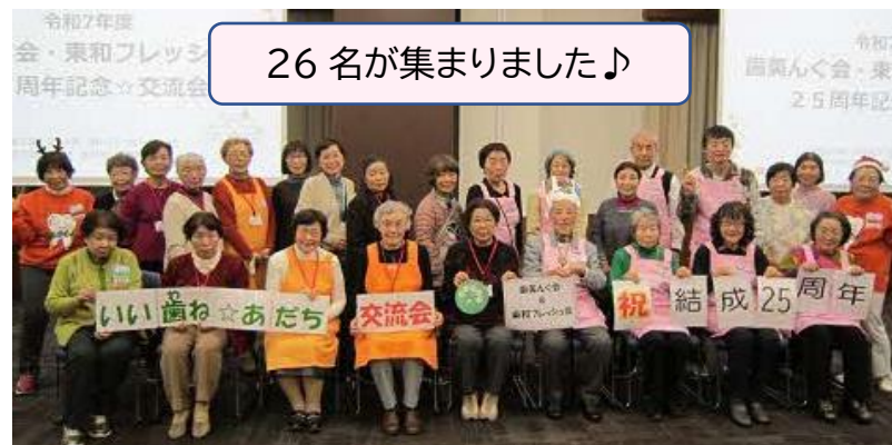
26名が集まりました♪