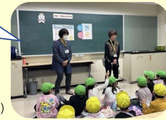
健康・噛むかむの会 (中央本町地域・保健総合支援課)