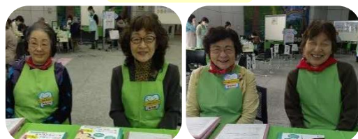
笑顔で声かけをしました