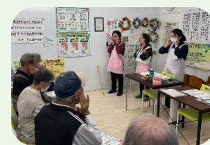
東和フレッシュ会 (笑顔のひろば)