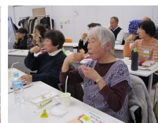
オーラルフレイルの予防法について再確認