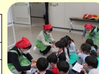
おくばみがきができたら、 ご褒美シールを渡します