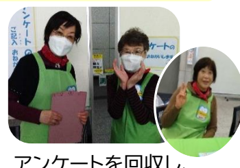
アンケートを回収し、お土産を渡しました