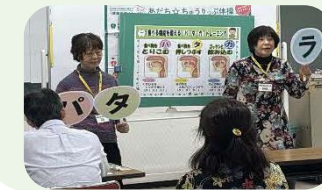
「ハ」「タ」「カ」を わかりやすく伝えました