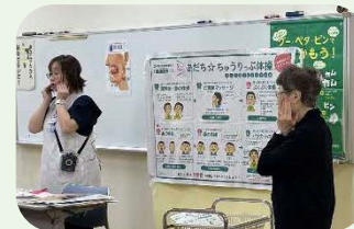
歯っぴい会 (竹の塚保健センター)