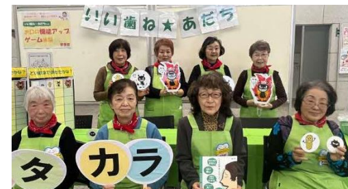
1日通して16名のメンバーで盛り上げました