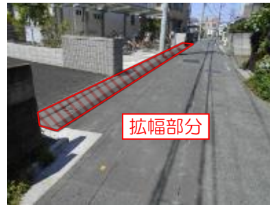
道路の拡幅整備後