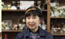
人と自然の共生館 フラクサ