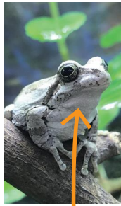
※下あごの皮膚の下にある膜

指先の吸盤で水槽の壁面に登っているため、腹面が観察しやすいです。多くのカエルのオスは、鳴嚢※という鳴き声を増幅するための皮膚の膜があり、鳴いた時は大きく膨らむ様子が観察できます。ニホンアマガエルは大きな鳴嚢を持つ、背中/bodyの色をゆっくり変化させるところもポイントです。