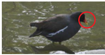
水浴びをするバン

※くちばしが延長したようなもので、繁殖期になると額板とくちばしの根元が赤くなります。