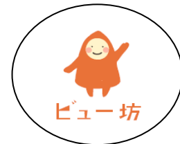
イメージキャラクター「ビュー坊」

※「ビューティフル・ウィンドウズ運動」とは、「美しいまち」を印象付けることで犯罪を抑止しようという足立区独自の運動です。区は、警視庁や区民のみなさんと協働して、まちの美化活動や防犯パトロールなどの取り組みを推進し、犯罪のない住みよいまちの実現をめざしています。