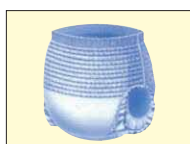
下着のように上げ下げが出来るタイプ