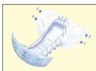
おむつカバーが不要なタイプ