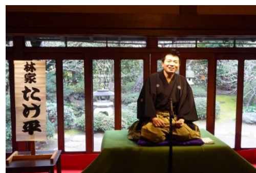
「一笑う門には福来る」 昭和の家<平田邸>