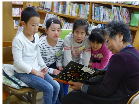
「放課後キッズ読書支援」