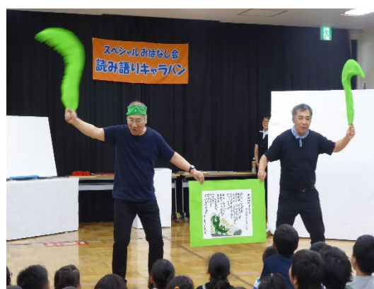
「読み語りキャラバン隊活動の支援」