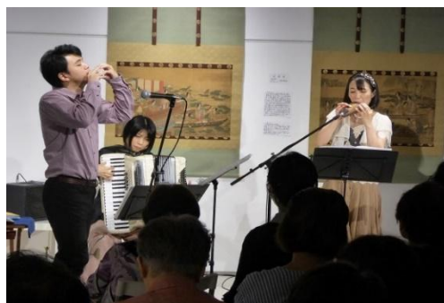
「月をうつす水面、土の笛の音」 六町ミュージアム・フローラ