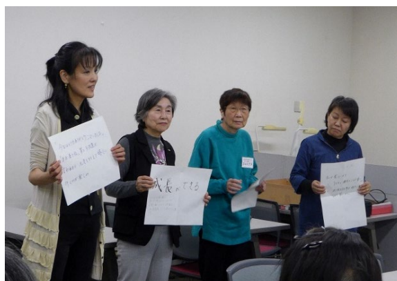
「サポーターフォロー講座 II」