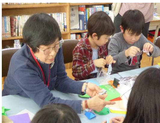
「おりがみサポーターの活動の支援」