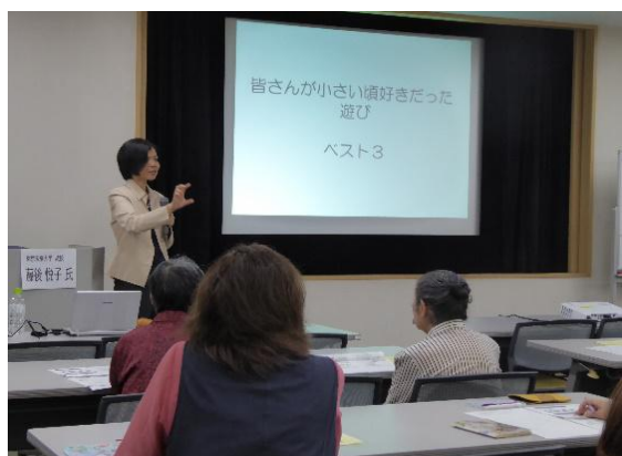
「サポーターフォロー講座 I」