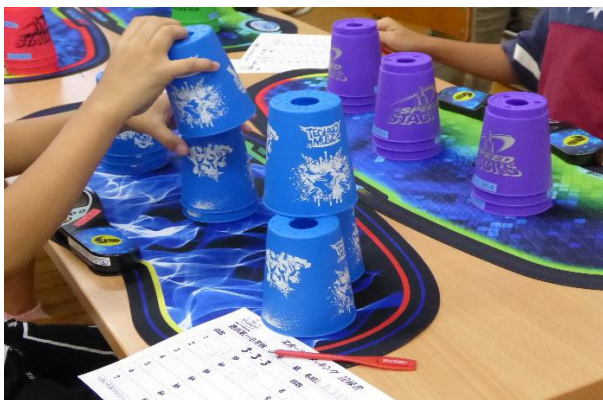
「スポーツスタッキング教室」