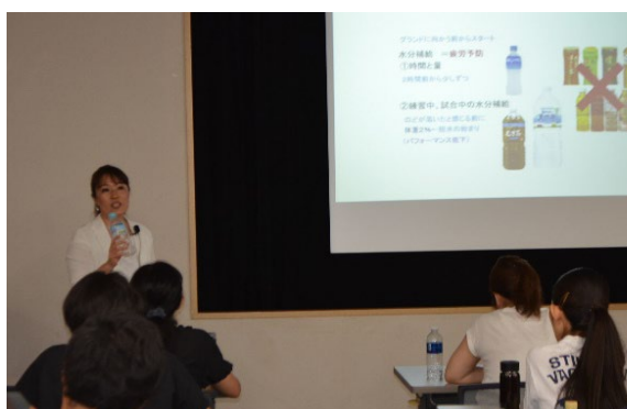
「スポーツコンディショニング講座」