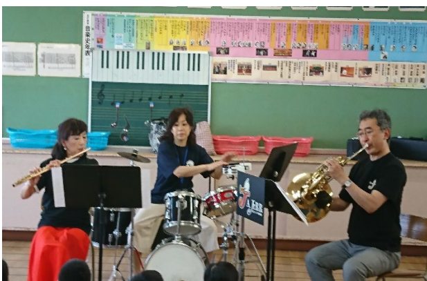
「ミニコンサート&楽器体験」