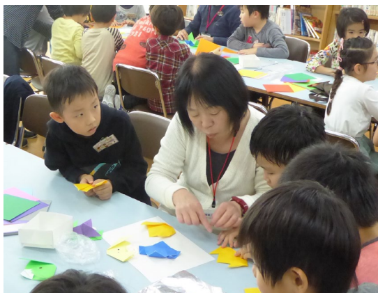
「放課後キッズおりがみ教室」