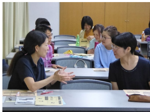
受講生同士での意見交換