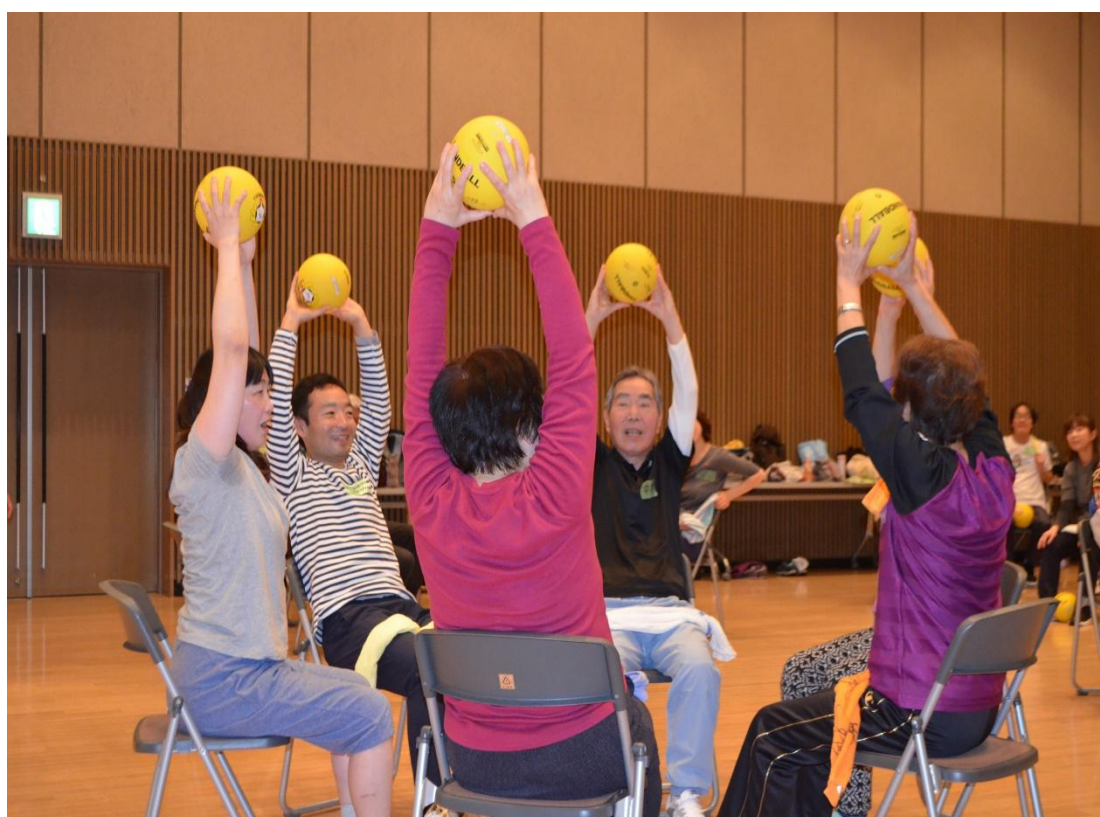
「スポーツ指導者スキルアップ講習会」～運動機能向上のためのトレーニング(高齢期)～