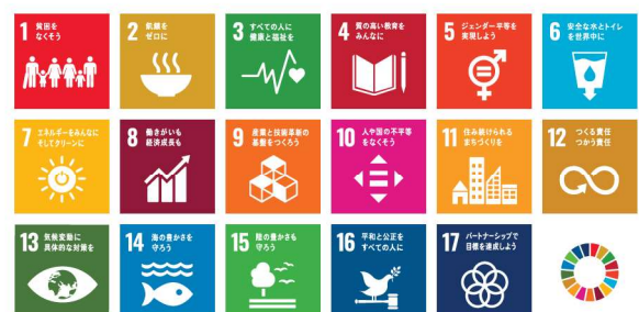
SDGs の 17 のゴールを示すアイコン

SUSTAINABLE DEVELOPMENT GOALS SDGs ロゴマーク